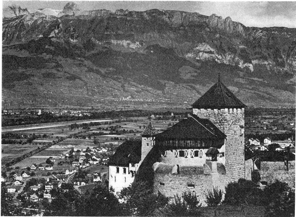
Schloss Vaduz, Ostansicht

rechts und links der Dämme: unübersehbare Maisfelder.