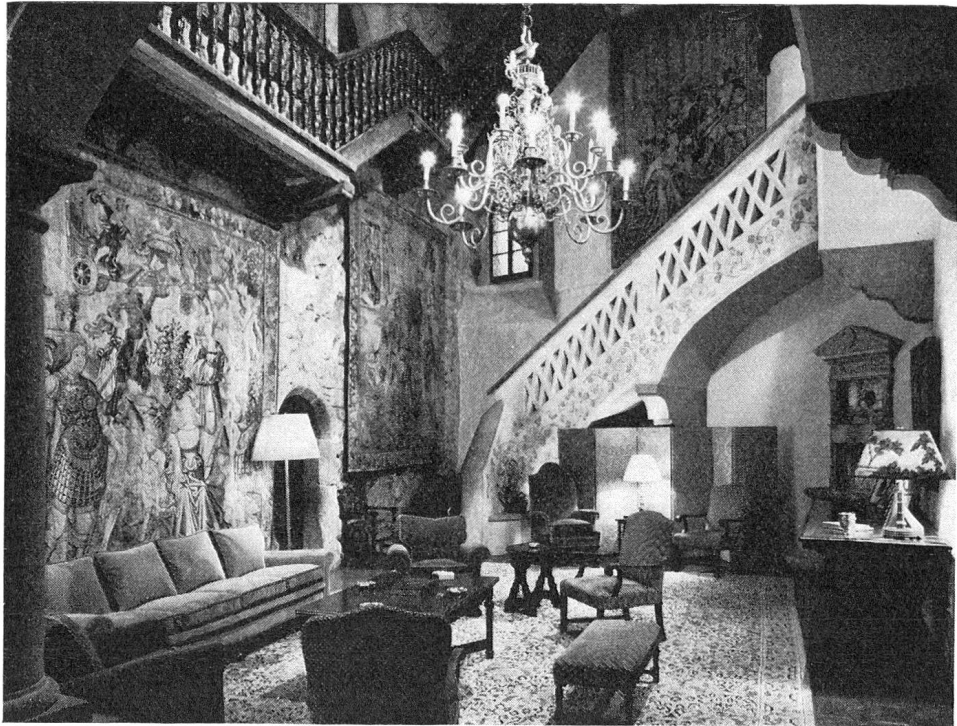
Schloss Vaduz. Die sogenannte Treppenhalle

es war ebenso naheliegend wie ehrend, dem Land den Namen des hochangesehenen Fürstenhauses zu geben, welches seine Vereinigung bewirkt hatte.