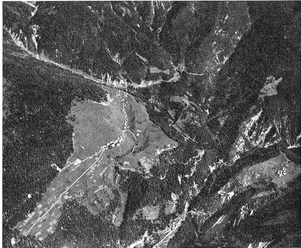
Bild 1 Flugaufnahme vom 9. 10. 34. Rechts des Dorfes Wiesen der Boden (Plateau). Hinter dem oberen Dorffende das Brügg- entobel. Ostwärts hinein die alte Zügenstraße. Ob ihr, Bildmitte, kleine Waldwiese: der Zapfal. Direkt östlich folgt der Ge- ländeeinschnitt des Sägetobels, an wel- chem der Hof «Am Bach» lag. Südlich des «Zapfals» und der Zügenstraße lie- gen zwischen Brügg- entobel und Sägetobel die «Egga» und der «Mühleboden».

genschlucht durch das Brüggentobel in zwei schon landschaftlich verschiedene Welten getrennt wird. Geologisch und besiedlungsgeschichtlich wird diese Trennung noch bedeutend erhöht.