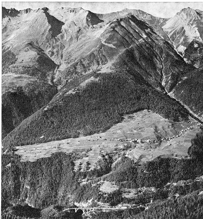
Bild 2 Dorf Wiesen westlich des Brüggentobels. Oben rechts am Bildrand Valbellahorn. Mitte, obere Bildhälfte, Wiesner Alp.

dürfte von Kornhisten herkommen. Die Bewohner dieses Hofes waren nach Urkunde 1544 Gemeinde Schmitten Flip, Jud und Nikka. Die Lage dieses Hofes bildete die Umgebung der heutigen Kopfstation des Übungskiliftes von Wiesen. (Sevelen hat eine Histengasse.)