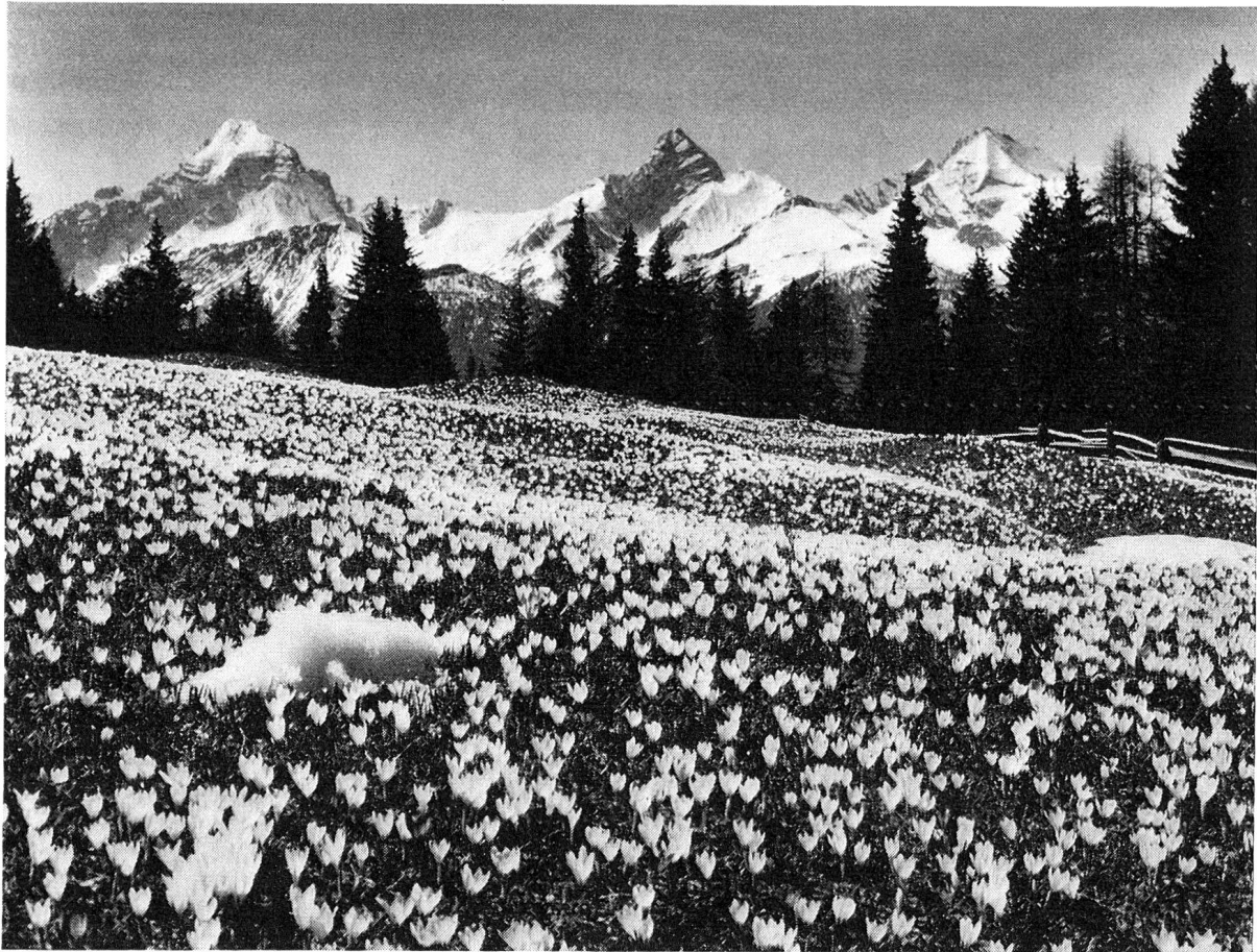
Und nun ein sieghafter Jubel. Tausend und abertausend Krokusse sprießen sanft geküßt vom warmen Hauch der wieder atmenden Erde.

Welle steigt lichtstrahlend empor, um das kalte Weiß des Winters im zarten Hauch durchglühten Lebens so schäumend weiß zu sprühen. Welch innig tiefes, ergreifendes Gebet des ewig siegenden Lebens über Tod und Vergehn! Und welch versöhnender Friede läßt dieses wogende Sein hier oben doppelt tief und harmonisch empfinden, weil es das schwindende Weiß des Schnees so frisch und duftig wiedergebiert. Kurze acht Tage nur wogt dieses weiße Meer täglich inniger glühend und gepriesen vom summenden Chor der Bienen, um dann plötzlich zu erblasen. Saftiges erstes Grün spricht kraftvoll Bergfrühling. Und daraus strahlt weithin leuchtend der Gelbsterne. Wenn auch bei weitem nicht so einheitlich geschlossen wie der Krokus, so prangt doch bald der Gelbsterne