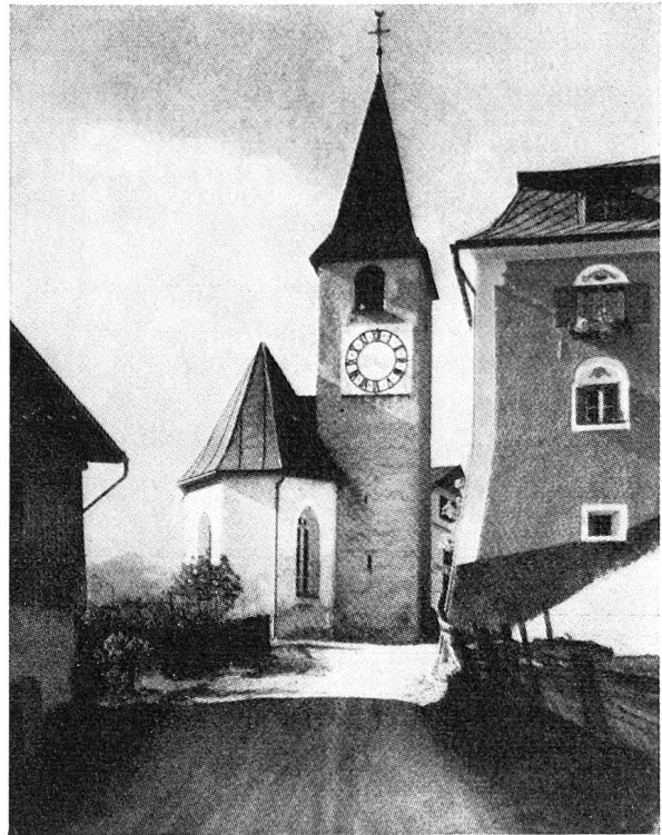
Das Chor unserer Kirche mit Turm. Das Chor — die einstige Kapelle St. Sebastian — wurde erst durch den Bau unserer Kirche um 1600 herum als deren Chor erschlossen. Diese bauliche Umstellung fand 1705 ihren Abschluß

Hier dürfte als Hauptursache die seinerzeitige Vermählung Walter III. von Vaz mit Adelheid von Montfort-Feldkirch im Jahre 1213 mitgespielt haben; denn diese Vermählung brachte Walter III. von Vaz in den Besitz der Herrschaft, des Prättigaus und von Davos. Die Vazer waren überragende Kenner der Bedeutung der Höhenrouten und der Pässe, wo es galt, durch jeweilige Ausweitungen ihres Gebietes neue Verbindungen für dessen Sicherung zu schaffen. Das Jahr 1213 bildete für solche Maßnahmen also einen Höhepunkt für die Freiherren von Vaz. Und so dürfte durch Walter III. die Höhenroute Schmitzen - Davos dadurch gesichert wor-