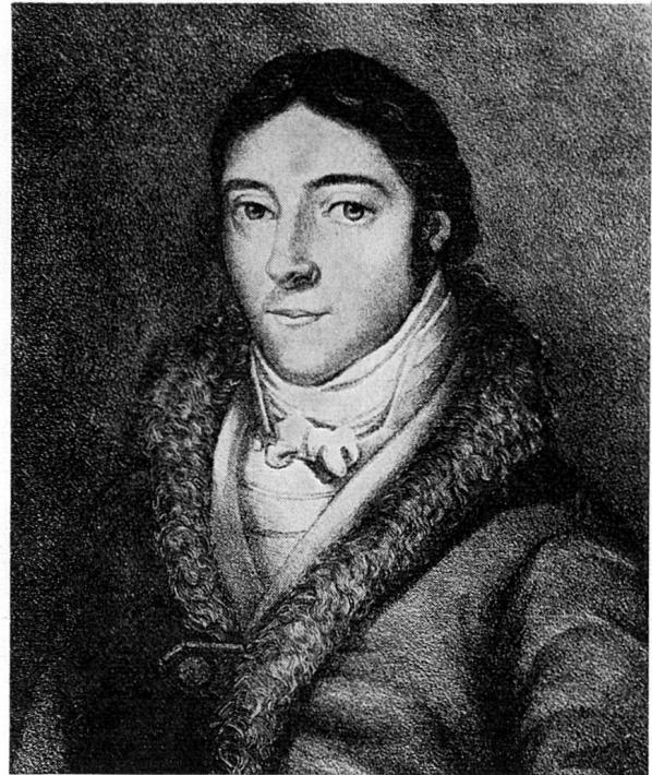
Johann Ulrich von Salis-Seewis

2 116 400.— wurde von der Bank in den Jahren 1923/24 zu Lasten ihrer Reserven ausgebucht.