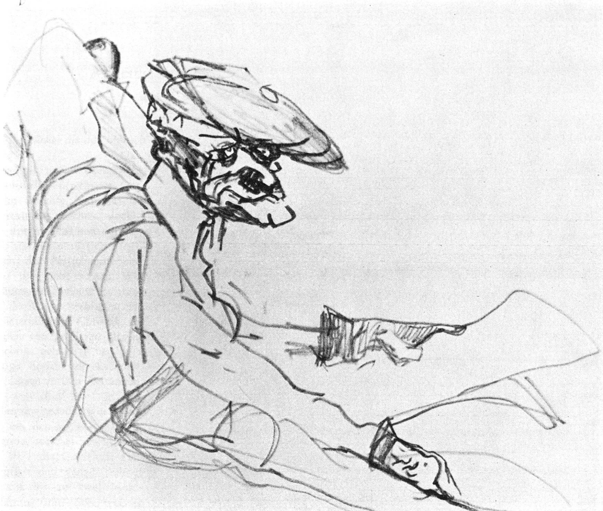
Varlin, «Mann im Park», New York, 1969