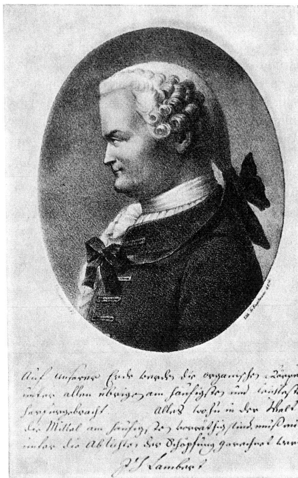
Johann Heinrich Lambert

an Kant: «Wolf hat ungefähr die Hälfte der mathematischen Methode in die Philosophie gebracht. Es ist noch um die andere Hälfte zu tun, so haben wir, was wir verlangen können.» Von diesem Grundsatz ging er aus in seinen Werken «Neues Organon», das er in Chur schrieb und später, 1764, veröffentlichte, und der «Architektonik» (1781). In beiden förderte er die Lehre vom Logikkalkül wesentlich.