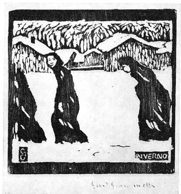
Giovanni Giacometti: Inverno, Holzschnitt, Neuerwerbung der Bündner Kunstsammlung.

angeschlagen wird, dürfen wir immerhin nicht vergessen, daß die Bedingungen, unter denen die Bündner Kunstsammlung konserviert und präsentiert wird, heute mehr als prekär sind. Zwar ist diese Sammlung im vergangenen Jahre erstmals von mehr als 4000 Personen besichtigt worden; aber nach wie vor werden die Bilder Kirchners, Augusto und Giovanni Giacomettis in künstlichem Licht ausgestellt; immer noch entbehren die großen Farbkompositionen Augustos des Resonanzraums, da sie in Zimmern hängen, die für Kleinformat gerade recht sind; auch heute noch muß bei jeder Wechselausstellung ein wesentlicher Teil der Sammlung in