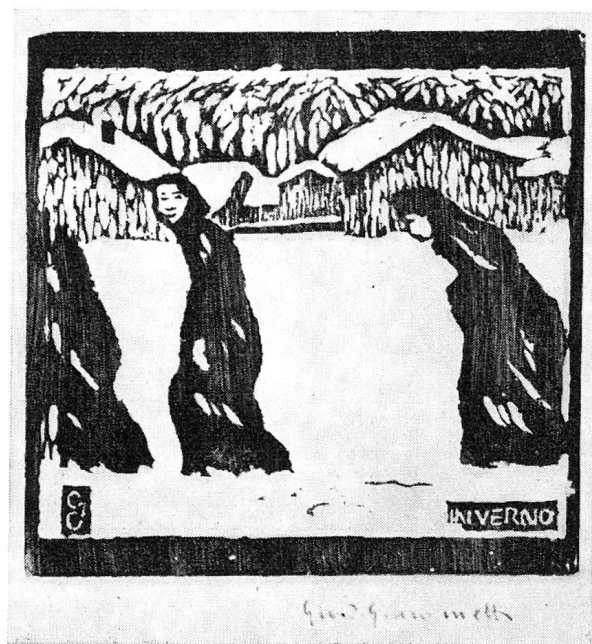
Giovanni Giacometti: Inverno, Holzschnitt, Neuerwerbung der Bündner Kunstsammlung.

angeschlagen wird, dürfen wir immerhin nicht vergessen, daß die Bedingungen, unter denen die Bündner Kunstsammlung konserviert und präsentiert wird, heute mehr als prekär sind. Zwar ist diese Sammlung im vergangenen Jahre erstmals von mehr als 4000 Personen besichtigt worden; aber nach wie vor werden die Bilder Kirchners, Augusto und Giovanni Giacomettis in künstlichem Licht ausgestellt; immer noch entbehren die großen Farbkompositionen Augustos des Resonanzraums, da sie in Zimmern hängen, die für Kleinformat gerade recht sind; auch heute noch muß bei jeder Wechselausstellung ein wesentlicher Teil der Sammlung in