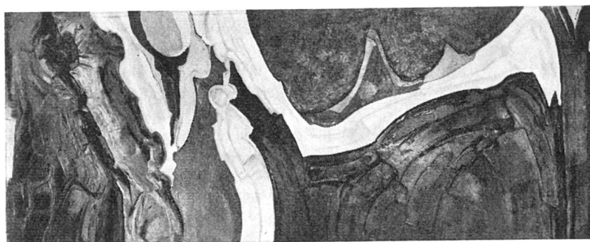
Jacques Guidon: Kontrapunkt, Wandgemälde, Gewerbeschule Chur

Eine engere Beziehung unserer Jugend zur bildenden Kunst wünschte man sich unter anderem auch im Hinblick auf die Architektur, die in den nächsten Jahrzehnten in unserem Lande entstehen wird. Dann werden die Jugendlichen von heute, auch wenn sie nicht Architekten werden, als Bauherren, als Behördemitglieder und ganz allgemein als verantwortliche Staatsbürger mit der Frage konfrontiert werden, was gute Architektur ist, und es wird für unser Land nicht gleichgültig sein, ob sie ein gewisses Proportionsgefühl haben, ja, ob sie angesichts des in Aussicht stehenden Profits ästhetische Gesichtspunkte überhaupt noch gelten lassen. Die Auseinandersetzung mit der Kunst sollte dazu führen, daß man einer gewissen Gefühlsduselei, die sich als Heimatkunst ausgibt, kritischer gegenübertritt oder ästhetisch verfehlte Überbauungen wie beispielsweise jene des Scawoba-Quartiers in Chur vermeidet. — Ob das ein frommer Wunsch ist?