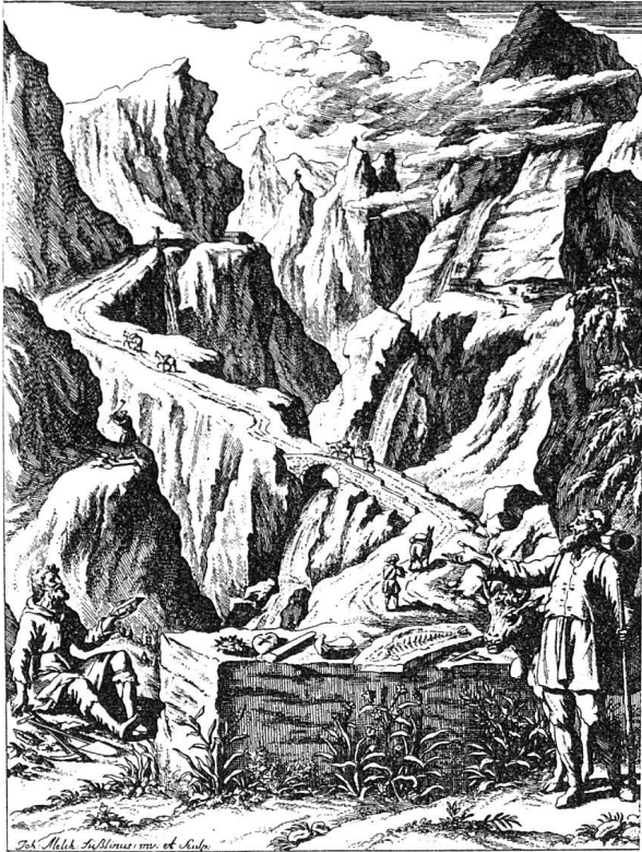
Kupferstich von Johann Melchior Füssli, vorangestellt dem Ersten Theil von Scheuchzers «Natur-Histori des Schweitzerlands», erschienen 1716 in Zürich, «In der Bodmerischen Truckerey».

sommer des Jahres 1742 machte er sich, gleich seinem großen Vorbild, selber in Begleitung eines Medizinstudenten auf zu einer Erkundungsreise «durch einige Orte des Schweitzerlandes» und ist dabei auch seinerseits ins Bündnerland gelangt. In der zweiten Augusthälfte jenes Jahres kamen die beiden bei grimmigem Schneetreiben über den Oberalp ins Tavetsch. «Wir folgten dem Lauff des vordern Rheins, welcher in dem Thal vor uns herflosse, und sahen ein paar Dörffgen, in welche wir gern hinabgestiegen wären, wenn wir uns getraut hätten fortzukommen. Doch wagten wir es bey einem andern, da wir denn durch einen unbeschreiblich bösen und steilen Weg in das kleine Dorff Selves kamen, wo wir vor unsre hungrige Bäuche nichts würden gefunden haben, wenn uns nicht der Priester des Orts (welcher zu allem Glücke in seinen zerrißnen Kleidern unter dem Hause, oder viel-