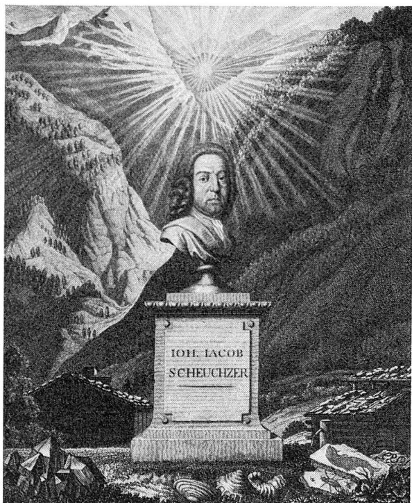
Ein Stich von Heinrich Lips, dem Traktat auf das Neujahr 1796 vorangestellt, welches die Conventstube der Chorherren im Andenken an Johann Jacob Scheuchzer der Zürcherischen Jugend widmete.

der Gesundheit kaum versuchen, vielmehr sich lange da aufhalten darf.»