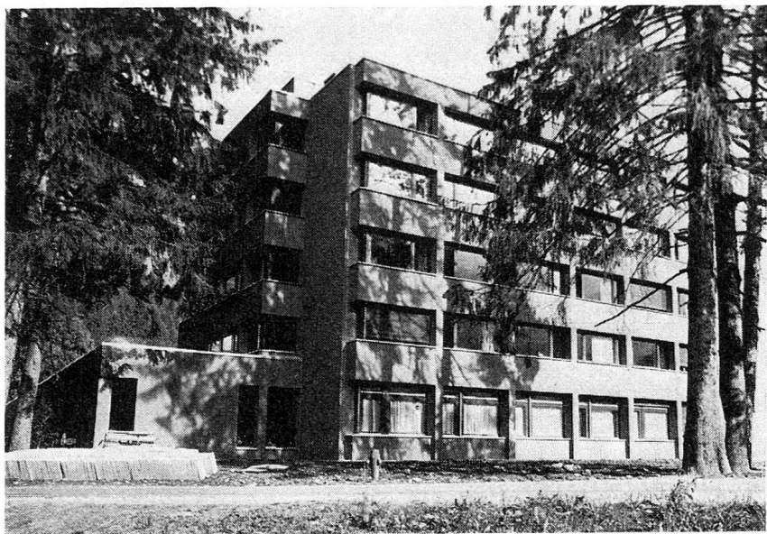
Das Altersheim in Rothenbrunnen von Architekt A. Liesch

Eine ungewöhnliche und sehr anregende Ausstellung war im Museum von Stampa zu sehen. Die Schüler einer Fotografenklasse der Zürcher Kunstgewerbeschule hatten unter Anleitung des Schriftstellers Hugo Lötcher das Bergell und die Bergeller fotografiert. Sie lieferten damit ein