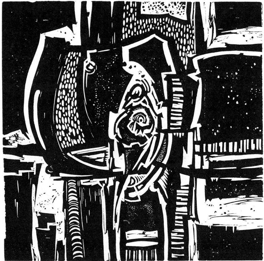
Jacques Guidon: Ohne Titel, 1973; Holzschnitt; Foto Bündner Kunsthhaus

Bei den Bildern, die während eines Aufenthaltes in Kanada entstanden sind, ist der Wille zur Bändigung noch deutlicher zu spüren. Auffallend ist bei diesen Arbeiten auch die farbliche Zurückhaltung. Schwarz und alle Abstufungen von Grau dominie-