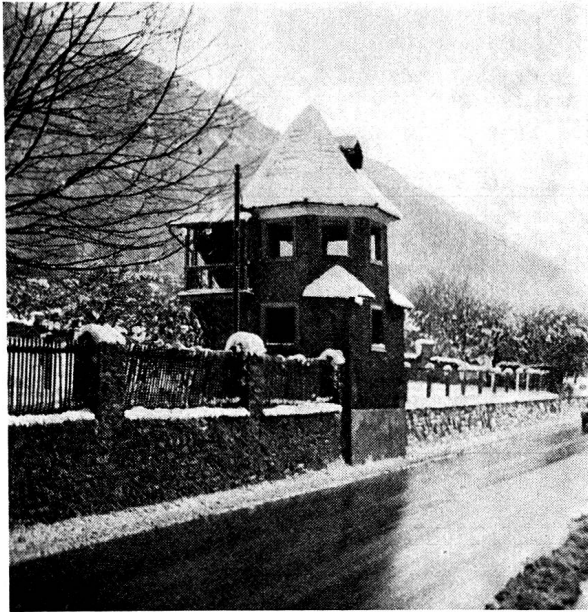
Bild 3. Das über Jahre hinweg vernachlässigte Lusthäuschen Kante an der Masanserstraße. Nun soll es an die im Hintergrund sichtbare Weinbergmauer versetzt und restauriert werden.

Nebst den oben erwähnten Windschutzmauern verdienen diejenigen im Kantengut und am Roterturmweg einen Hinweis, obwohl sie leider teilweise mangels Unterhaltspflege defekt sind. Beide ließen sich durch planerische Vorkehr — vorausgesetzt, das kulturelle Verständnis wäre da — der Nachwelt erhalten. Im Kantengut hat sich im Frühjahr 1975 eine teilweise befriedigende Lösung angebahnt, indem das Lusthäuschen Kante an die Mauer versetzt werden und diese zu einem leider nur bescheidenen Teil erhalten werden soll (Bild 3).