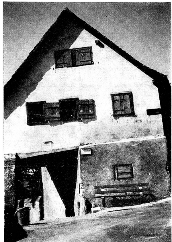
Bild 4. «Hubers Hüsl». Wohl nach dem Namen seines letzten Bewohners benannt. Mit ihm sind durch den Ausbau der Lürlibadstraße der Meiertorkel und ein weiteres Weinberghaus und durch den Bau von Beton-Stützmauern anstelle der alten Bruchsteinmauern der ländliche Charakter des Lürlibades weitgehend verlorengegangen.

Ich vermochte noch etwa 20 bestehende Weinberghäuschen in Chur ausfindig zu machen. Viele sind in baufälligem Zustand, andere werden unterhalten, und einzelne wurden bestens renoviert. Als Beispiele möchte ich «Hubers Hüsl» (Bild 4) und das Pächterhaus an der Masanserstraße erwähnen (Bild 5).