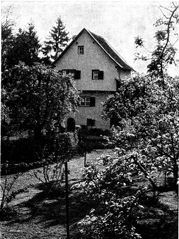
Bild 5. Altes Pächterhaus an der Masanserstraße, Nähe Turnerwiese. Die Fassade hat einen zurückhaltenden Rosastich bekommen, der dem Haus im Grün des Gartens einen reizenden Anblick gibt.

Eine interessante Bauweise findet sich an den Pächterhäuschen am «Stinkgäßli» (Nähe Salisstraße) und an jenem von Frau Hoffmeister-Walser an der Masanserstraße. Beide