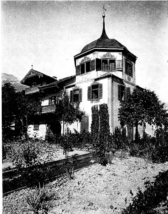
Bild 7. Der Rote Turm an der Ringstraße. Er steht im Eigentum der Churer Bürgergemeinde und unter Schutz.