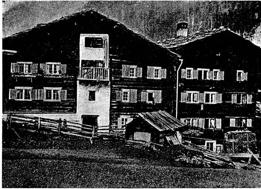
Der Landsgemeindeplatz in Safien beim Rathaus (rechts).