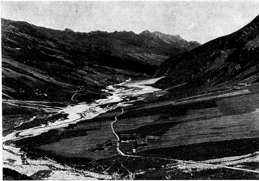
Verwüstungen durch Hochwasser und Rufen.

Hochwasser wütete, alle Brücken und Wuhre zerstörte im ganzen Tale und Wohnstätten bedrohte und wie Mißwachs und Teuerung Kummer und Not verursachten. Das Bündner Monatsblatt 1957 hat darüber vom Schreibenden eine ausführliche Darstellung gebracht.