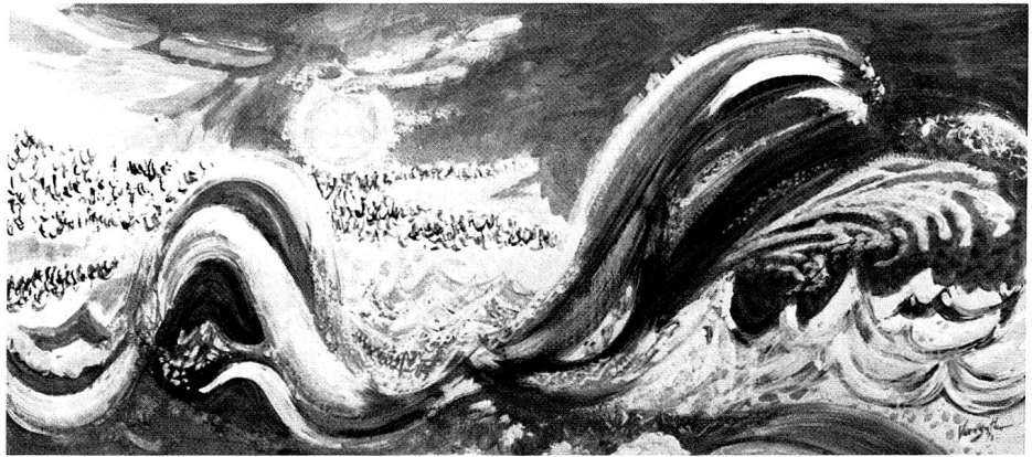
Gelbe Welle in der Gischt, 1972