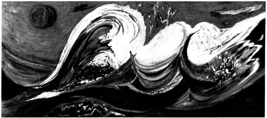
Grüne Wellen im Sturm, 1972