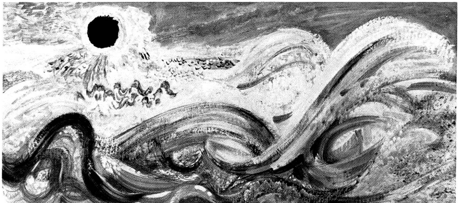
Sturm, Gischt und Sonne, 1973