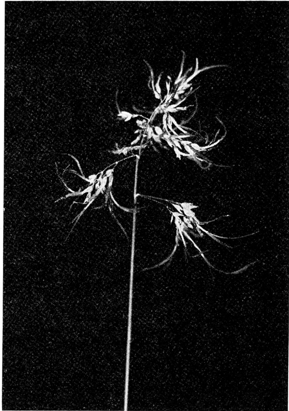
Alpen-Rispengras, lebendgebärende Form.

Über die Ursache des Lebendgebärens bei Pflanzen ist man sich noch nicht im klaren. Dagegen zeigt sich, daß die lebengebärenden Arten hauptsächlich an Orten mit extremen Lebensbedingungen vorkommen. Der Verfasser des Buches «Das Pflanzenleben der Alpen», C. Schröter, ist der Auffassung, daß die vivipare Form des Alpen-Rispengrases im Alpenklima mit seiner kurzen Vegetationszeit und der Unsicherheit der Fruchtreife gegenüber der samenbildenden im Vorteil sei. Ich selbst konnte ob dem Wildsee am Pizol eben ausapernde, frischgrüne Alpen-Rispengras-Stöcke feststellen, deren Laubknospen, noch nicht fertig ausgebildet, imstande waren, sich im kommenden Sommer vollends zu entwickeln. Mit ähnlichen Lebensbedingungen wird auch der Nickende Steinbrech fertig. Das Knollige Rispengras wiederum ist ein Pionier auf Kiesbänken, Mauerkronen und Trockenwiesen. Es gedeiht also ebenfalls an Orten, deren Pflanzendecke oft Lücken aufweist und wo Laubspresse infolgedessen leicht Fuß fassen können. Dasselbe gilt vom Kleinen Schwingel, der trockene Felsspalten und offene Rasen besiedelt. Auch die Laucharten und die Feuerlilie