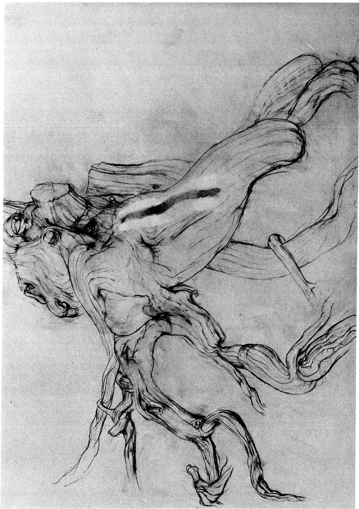
Mathias Balzer: Strunk, 1971, Bleistift und Deckfarbe, 31 x 44 cm, Privatbesitz, Aufnahme: Konrad Kunz