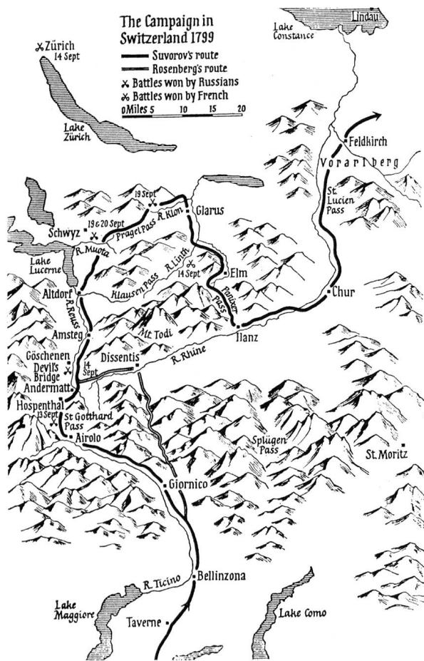
Der Marsch Suworows in Graubünden

kopfs oder Bündnerberges. Zwei Fuß hoher neuer Schnee hatte den hundertjährigen, allgemein Gletscher genannten bedeckt und das Ersteigen unendlich erschwert; doch war noch manches Stück Weges und zum Teil auch hinlänglich breit zu finden, nur Steile und das Weichen des neuen Schnees unter dem Fuße machte jeden Schritt so ermüdend beschwerlich, daß selbst der einzelne Mann zu 100 Schritt Gewinnst eine halbe Stunde benötigte. Und doch war das bisher Versuchte nur unbedeutende Kleinigkeit im Vergleich mit dem, was noch bevorstand. Mit dem Erreichen des höchsten Rückens fingen erst die Beschwerlichkeiten an, welche durch wenige Ordnung der Colonne bis auf den Grad anwuchsen, welchen keine Feder zu beschreiben vermag. — Ein augenblicklicher Sonnenstrahl ließ ganz Bünden und halb Tirol übersehen, nur zu-