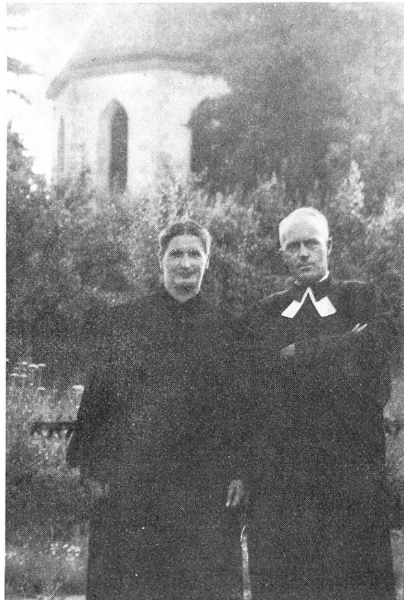
Im Pfarrgarten Kilchberg.