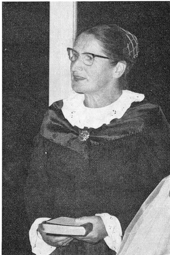
Als Hochzeitsgast auf der Au.

Ich weiß nicht, aber das Faktum an sich, daß verheiratete Frauen einen Beruf ausüben, dürfte es wohl nicht sein, das Anstoß erregt, denn die Schweiz allein zählt 210 000 berufstätige, verheiratete Frauen. Ich habe aber noch nie einen Zeitungsartikel gelesen, der sich gegen die Arbeit dieser Frauen ausgesprochen hätte, obwohl hier sicher die soziale Fürsorge ein weites Arbeitsfeld hätte, den vielgeplagten, arbeitenden Frauen zu mehr Zeit, Energie und Frohmut für ihre Familien zu verhelfen. Es muß also die Verbindung dieser einen speziellen Berufsart mit der Ehe sein, deren Möglichkeit fraglich erscheint. Hierzu ist zu sagen, daß dies von Familie zu Familie wieder anders zu lösen ist. Es kommt auf die Zahl der Kinder und vor allem auf die Größe der Gemeinde an. Ich kann also nur von meinem, dem einen praktischen Fall sprechen, und ich möchte das einmal gründlich tun. Meine Gemeinde zählt 216 Einwohner. Ich habe jeden Sonntag zu predigen, montags 3 Unterrichtsstunden zu erteilen, donnerstags 2 und samstags 2, jeweilen vormittags. Furna ist also eine