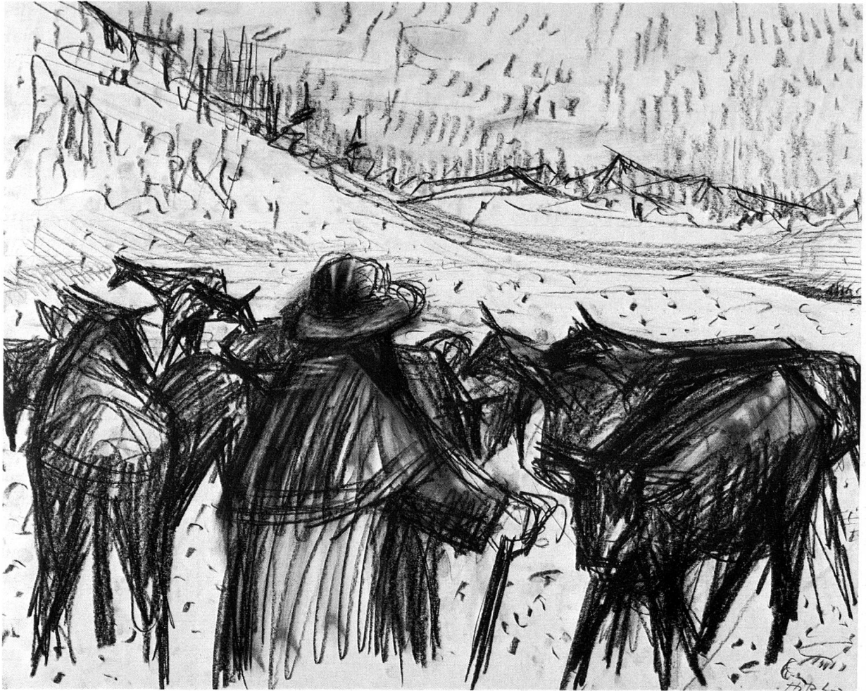
Hitz Leo: Schneehirte, Zeichnung, 52 × 42 cm