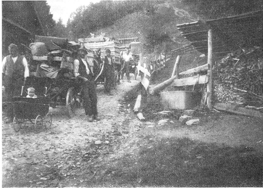
Züglata auf Furna.

mand. Denn es ist Brauch, daß die Männer abends in ihrer Familie bleiben. Der Gemeindepräsident selber war sehr gegen diese Gemeindestube, aus der Erwägung heraus, daß sie die Männer gewöhne, von zu Hause fort zu sein, und wenn jetzt zu einem guten Zweck, so könne daraus auch die Gewohnheit des Wirtshaushockens werden. Ich versuchte darauf den umgekehrten Weg. Ich band mit den Schülern zusammen soviel Mappen als Haushaltungen sind und lasse nun die Mappen zirkulieren, mit der Garbe, der Elternzeitschrift, Leben und Glauben, Heimatstimmen, Schweizerspiegel und Schweizer Hausfrau, je nachdem, was wir geschenkt erhalten. Aber auch das ist nicht einfach, denn es braucht die Disziplin der einzelnen Familie, die Mappe zur Zeit und vollständig weiterzugeben.