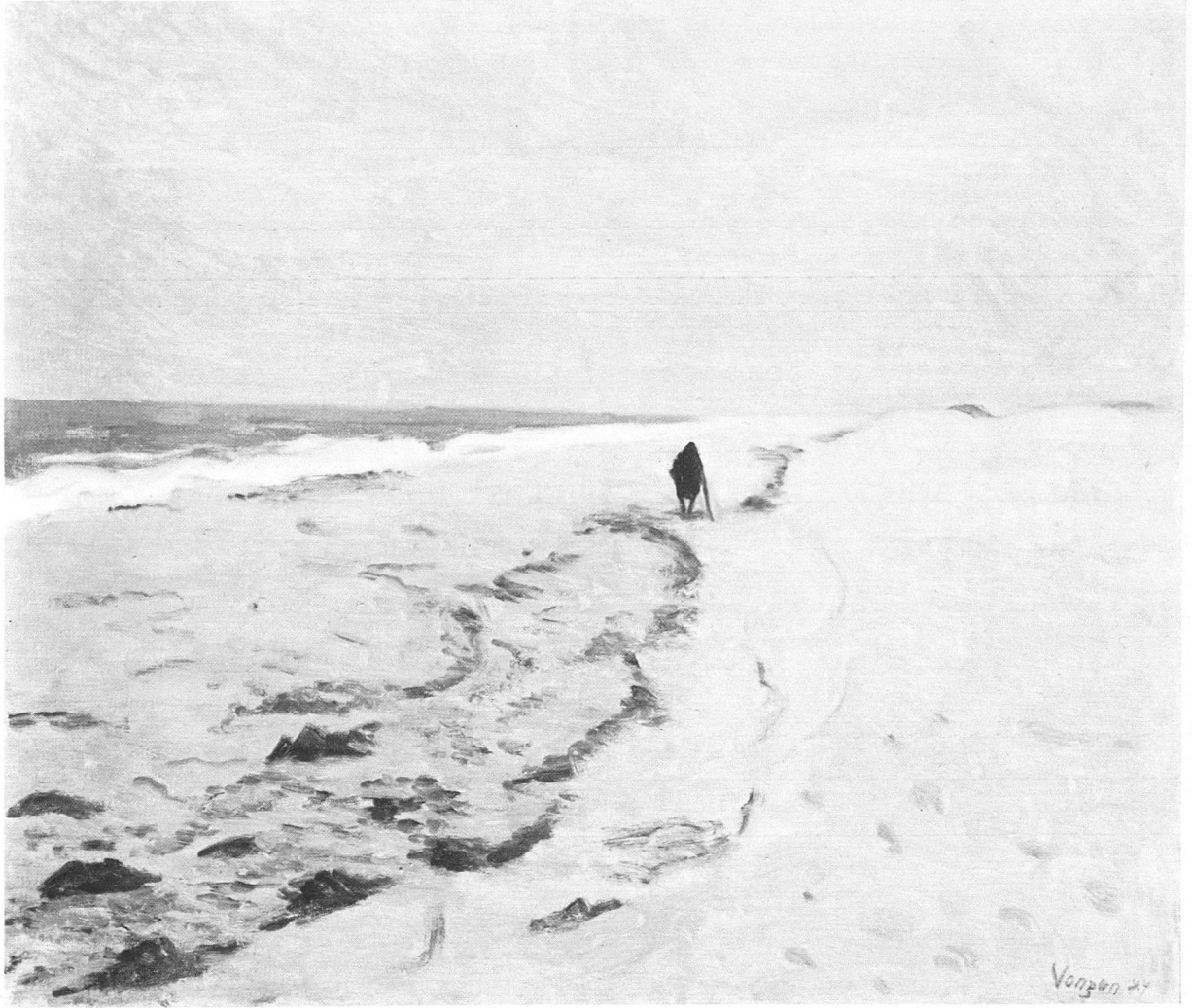
Anny Meisser-Vonzun: Der einsame Strand