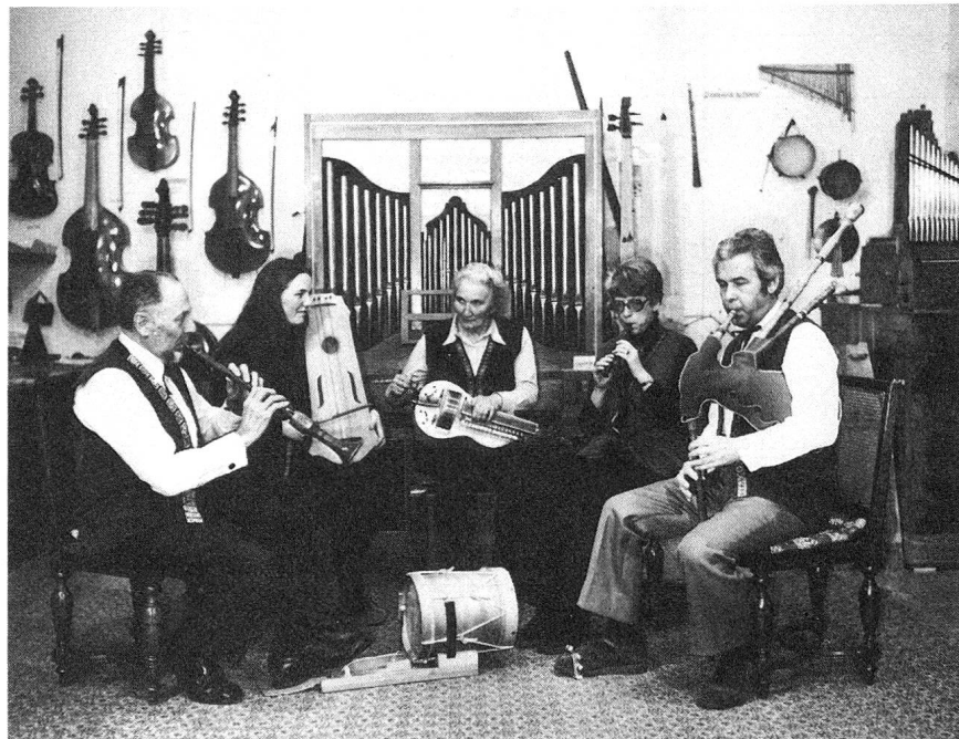
Das «Alte Consort» in der Instrumenten-Sammlung des Konservatoriums Winterthur. (Instr. v. l. n. r.) Schalmai, Tambourin du Béarn, Radleier, Kleinflötlein und Dudelsack.