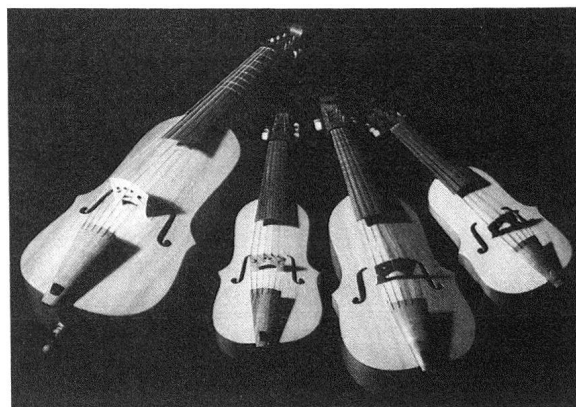
Das «Fidel-Consort» (Diskant, Sopran, Alt, Tenor-Bass) im sog. Werkstatt-Model, wie Patt sie auch heute noch baut. Diese Form wird auch als Gamben-Fidel bezeichnet.

Inzwischen hat sich Christian Patt mit den verschiedenen Möglichkeiten des Fidelbaus als Konstrukteur und als Spieler auseinandergesetzt und baute ein eigenes, sehr gefälliges und gut spielbares Modell, das seither in den Schweizer Kursen als «Modell Patt» bezeichnet wird. 1957 wurde dasselbe durch eine geschweifte Zargenbauweise deutlich verbessert. Patt baut es heute noch auf Wunsch als sein Werkstattmodell. Das Jahr 1961 brachte Chr. Patts Arbeit bedeutende Fortschritte: in der Fidelreihe wurden erstmals auch ganz hohe Diskantfideln gebaut, ausserdem wurde erstmals ein Instrument nach Übersee geliefert, nämlich nach Kalifornien. Unter Christian Patts geschickten Händen waren bis 1961 über hundert Fideln entstanden und in 20 Kursen sind von den vielen Teilnehmern etwa doppelt so viele gebaut worden. Diese Kurse brachten für den Initiator viel Vorarbeit, aber auch eine Fülle von Erfahrungen. Ganz verschiedene Holzarten wurden verwendet. Üblicherweise bestehen der Boden und die Seitenwände (Zargen) aus Ahornholz. Für die Decke wird Fichte verwendet. (Am besten