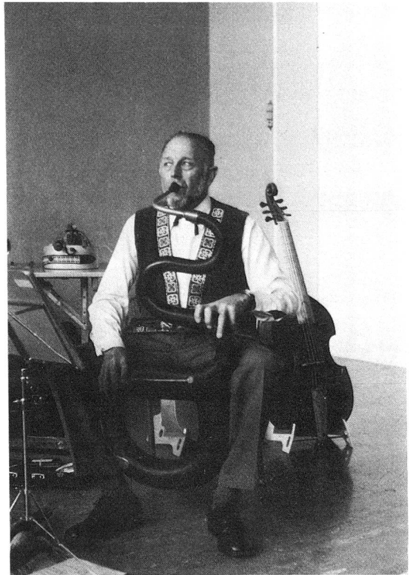
Das Bass-Blasinstrument, das erst im 19. Jahrhundert durch die Bass-Tuba ersetzt wurde: Der Serpent (Bass-Zink).