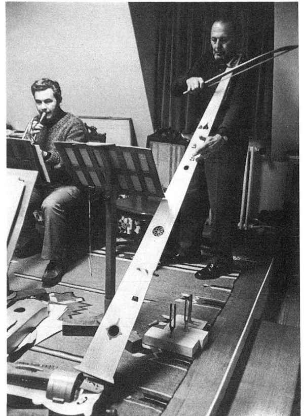
Schwieriges Zusammenspiel muss geübt sein: Clarin-Trompete und Trumscheit.

Ton, auf den sie gestimmt sind, oder mit dessen Obertönen, mit. Dies ergibt einen klingenden Grundton, der begleitet wird von mitschwingenden Tönen, die als Sympathie-Aliquot- oder Resonanztöne bezeichnet werden. Als spielerischer Zusatz i. e. S. wird die Spielsaite über einen sogenannten Schnarrsteg geführt, das heisst einen kleinen Steg mit zwei verschiedenen langen Füßen. Der kürzere Fuss steht senkrecht auf dem Resonanzboden, der andere, ausladende, um eine Spur verkürzt, berührt den Boden um ein Minimum nicht. Erst beim Anstreichen der Melodiesaite wird dieser bewegliche Fuss in Schwingung versetzt und «trommelt» auf den Resonanzboden. Man nennt dies einen Schnarrsteg, weil er einen lauten, scheppernden Klang erzeugt, welcher eher als originell denn als wohltönend bezeichnet werden muss. Es ist erstaunlich, dass dieses ausgefallene Instrument trotz seiner beschränkten Möglichkeiten, trotz seiner schwierigen Bauform und seiner unge-