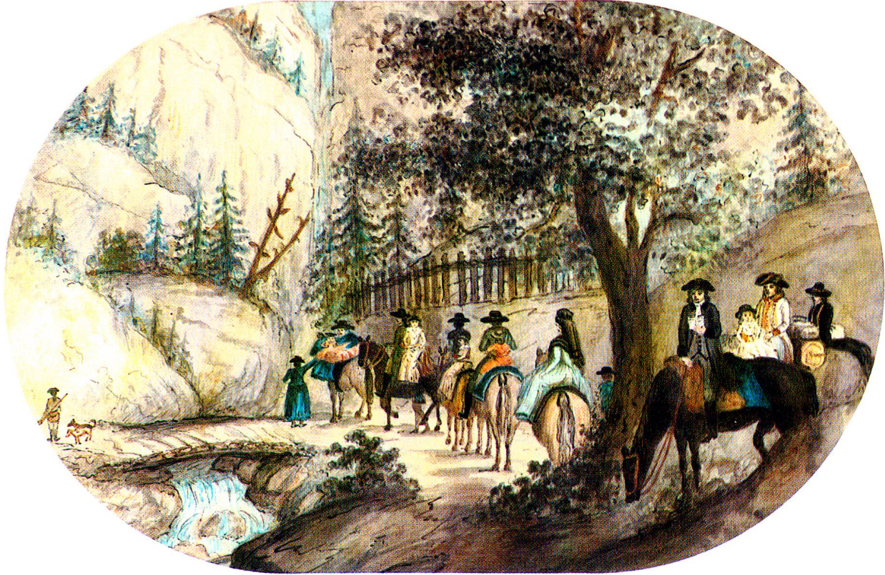
Reisezug Davos-Grüsch, Herbst 1790 (Aquarell von Anton Sprecher)