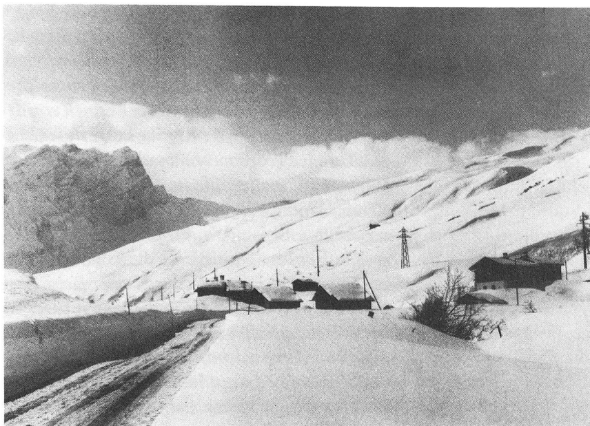
Der winterlich verschneite hinterste Teil des Safientales, die Heimat der Zisli/Zinsli.