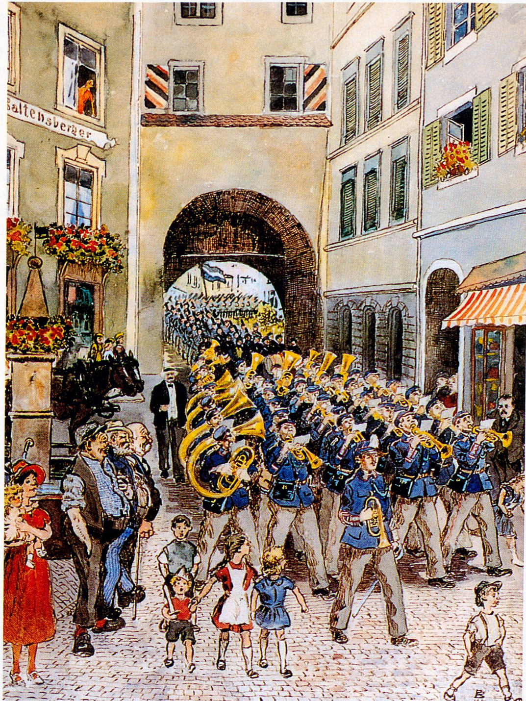
Paul Bühler: Einzug der Kadetten durchs Obertor, kolorierte Federzeichnung