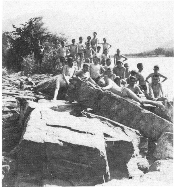
Gänzlich abhalten von ihren Badefreuden liessen sich die Churer Burschen durch das Verschwinden der Grundwassertümpel an der Halbmyl nicht: sie wandten sich einfach dem Rhein zu und oblagen in ihm ihren Schwimmkünsten. Aufnahme aus dem Jahre 1923.

gar mancherlei Konsequenzen erwachsen. Da mag einmal darauf hingewiesen werden, welch gewaltige Umstellung das Verschwinden des Pferdes und damit der Rosspollen für die Churer Spatzenwelt mit sich gebracht hat. Eine wichtige Nahrungsquelle ist ihr entzogen worden, denn es hatte im Ausstoss des Haber-motors immer noch nahrhafte Residuen. Es wäre dies gewiss ein dankbares Thema für die Verhaltensforschung, denn die Spatzen mussten sich doch irgendwie umstellen, oder sind sie ausgezogen? Ich würde es für möglich halten, dass wir in der Stadt heute weniger Spatzen haben als früher. Dafür haben wir den Gestank der Autos. Ich denke an jenen für das Mistbeet des Gartens Rosspollen sammelnden Buben, der den ersten Autos in gerechtem Zorn nachrief: «Stinken könnt ihr, aber Rosspollen machen könnt ihr nicht!» Aber haben die Pferdefuhrwerke nicht auch etwa gestunken, zumalen im Sommer? Wer weiss noch, was ein Bremenkeffel ist? Er hing an der Wagendeichsel, und in seinem Innern glühten und