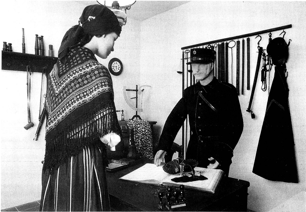
Zollmuseum Gandria (Tessin).

Eines schönen Morgens erschien die junge Elsässerin beim kleinen Grenzübergang und meldete sich zur Einreise. Kurz zuvor war die oben erwähnte Zöllnersfrau Richtung Basel weggefahren. Der Beamte wollte es nun einmal wissen und stellte die übliche vorschriftsmässige Frage nach mitgeführten Waren – die verneint wurde. Darauf kontrollierte der Beamte die mitgeführte Handtasche und entdeckte darin tatsächlich nur gebrauchte Handschuhe, Schal und Taschentuch; der Lippenstift gehörte damals noch nicht zur Ausrüstung. Der Zöllner wollte der Frau eine nochmalige Gelegenheit geben, ihr Gewissen zu erforschen und wiederholte die Frage nach mitgeführten zollpflichtigen Waren. Sie aber verneinte in bestimmtem Tone. Darauf eröffnete der Beamte der Grenzgängerin, er ordne eine körperliche Durchsuchung an und complimentierte sie ins gut gewärmte Zollbüro, wo er ihr einen Stuhl am warmen Ofen anbot. Die