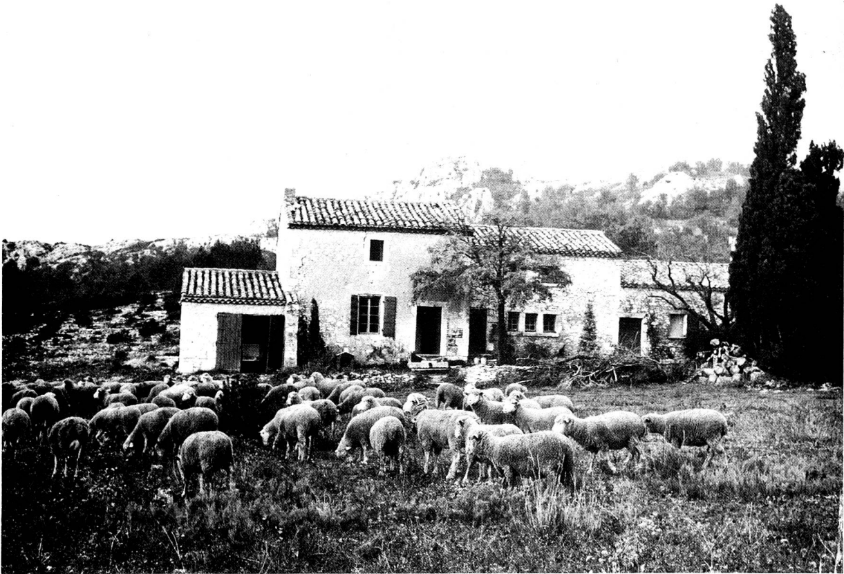
Das Wohnhaus des Künstlers in Südfrankreich.