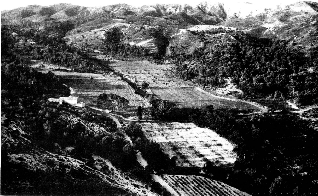
Die Landschaft des Verstorbenen in Südfrankreich.

So stand ich damals vor dem «Mas de Cinq Sous» mit seinen kleinen, dem auch hier in der Provence kalten Winter trotzenden Fenstern, dem Holzstapel vor dem Haus und dem alten Steintisch, an dem ich noch so manchen langen Sommerabend verbringen sollte.