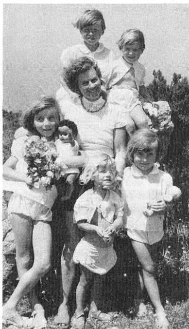
Die Verstorbene in den sechziger Jahren mit ihren Adoptiv- und Pflegekindern beim Ferienvergnügen am Meer.