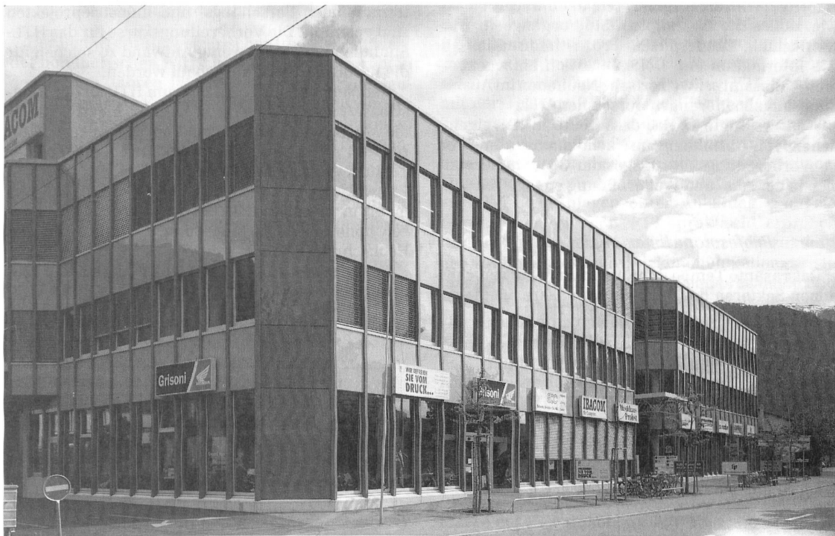
Die Telecom-Praktika sind an der Ringstrasse 34 in Chur untergebracht.

Von den insgesamt 737 erfolgreichen Absolventen der Churer HTL arbeiten über 80% im Einzugsgebiet der Schule. Damit ist eines der wesentlichsten Ziele, nämlich die Wirtschaft der Region mit höherem Fachkader zu bedienen, in hohem Masse erfüllt worden. Die HTL und ihre Ehemaligen erbringen damit auch eine gewichtige volkswirtschaftliche Leistung, die für einen Kanton wie Graubünden mit seiner ausgeprägten Abhängigkeit vom Tourismus von unschätzbarem Wert ist.