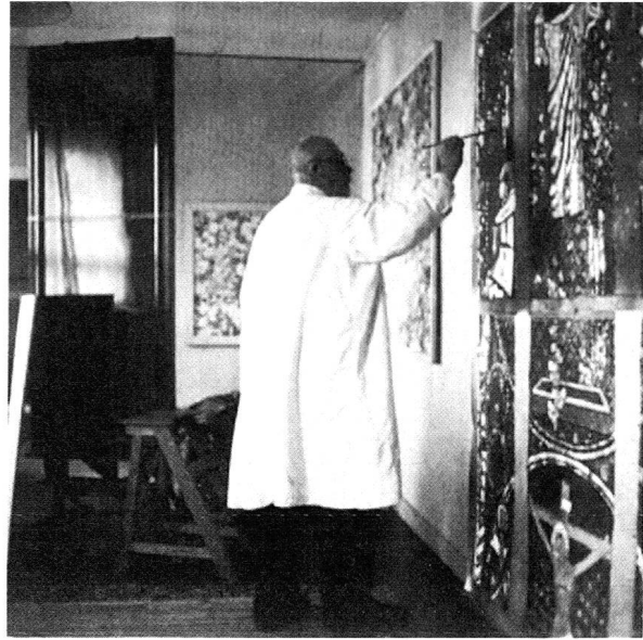
Augusto Giacometti (1877–1947) in seinem Zürcher Atelier. Die Aufnahme zeigt den Maler während der Arbeit an Entwürfen für die 1943 ausgeführten Glasgemälde der Wasserkirche in Zürich.

Die hier ausführlich wiedergegebenen Stellungnahmen der Beteiligten und des Publikums werfen ein Licht auf allgemeine Probleme bei Auftragswerken der Öffentlichkeit. Die Entstehung und Realisierung der Churer Glasgemälde von Augusto Giacometti wurde von Begeisterung, Skepsis und Ablehnung begleitet. Streiter für die Sache des