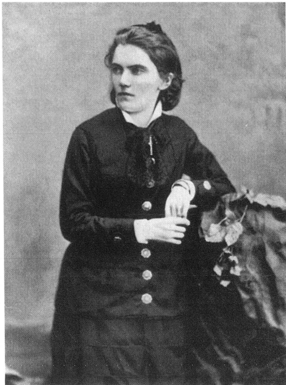
Meta von Salis-Marschlins.

zu schweben scheint, ist der einsamste, stolzeste und zarteste Mann unseres Jahrhunderts in sein angestammtes Reich getreten, wie ein in der Verbannung geborener Königssohn. Auf den moosigen Pfaden der Halbinsel, den tiefblauen Silser See entlang nach Isola, den Lärchenwald hinauf nach Laret oder Bella Vista, an der Sägemühle vorbei nach dem minder intensiv blauen See von Silvaplana und an dessen waldigem Ufer hin zum Zarathustrastein, wo die Wiesen des verlassenen Surlei beginnen, durch die Schlucht gegen das Fexthal hin – Sommer um Sommer ist er seit 1881 da gegangen, vor sich hinsinnend, das Auge auf Berg und See ausruhend, langsam, langsam, oder rasch, «ein Tänzer», wenn er mit Gedankenbeute beladen seiner Höhle zueilte. Eine Gestalt, die Mancher gewahr wurde, der ihm betroffen in's Antlitz schaute und doch nicht ahnte, dass ihn Späterkommende beneiden würden um den einen Blick.» (25)