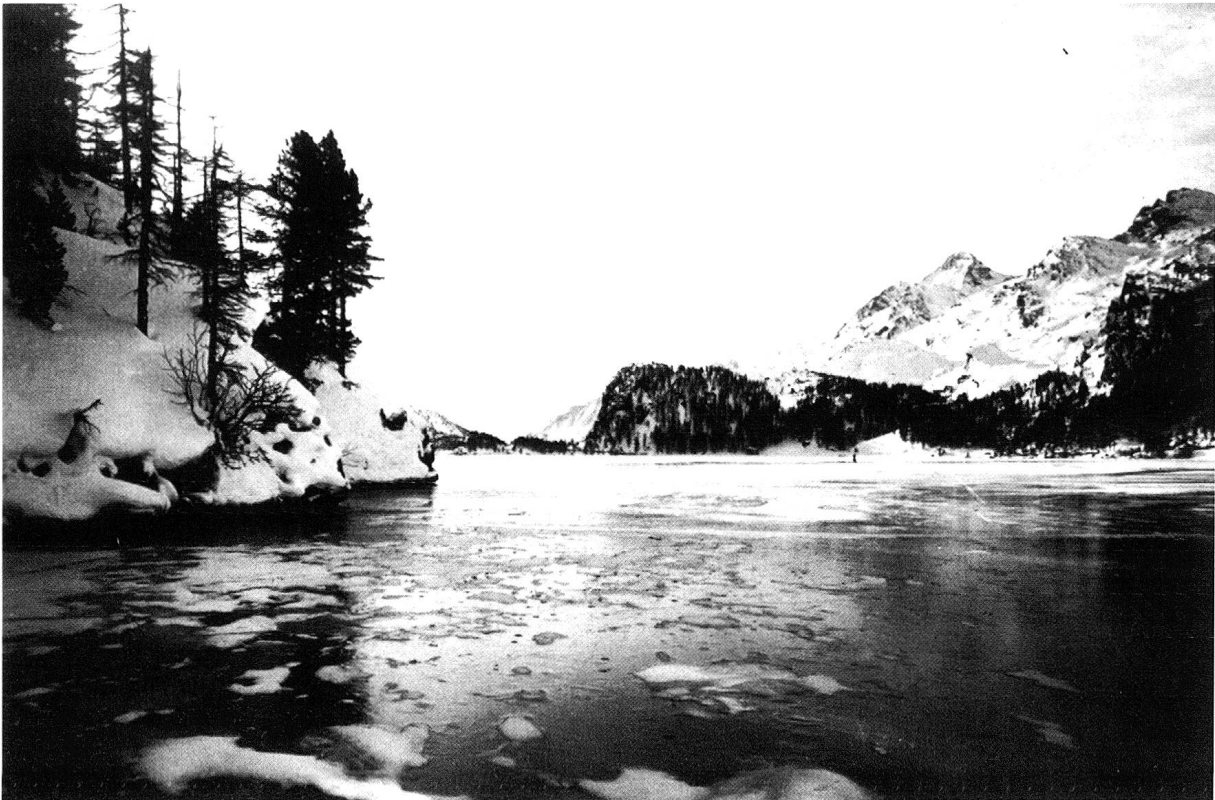
Gefrorener Silsersee. Links: Halbinsel Chastè.