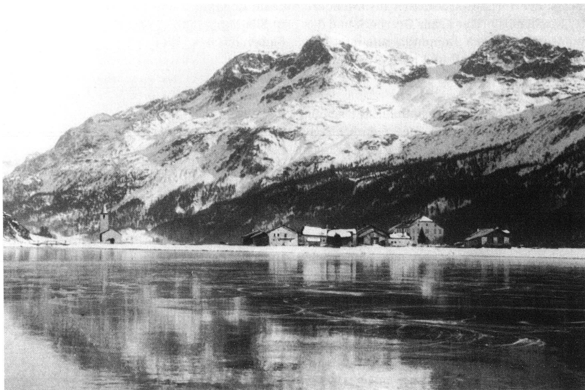
Sils Baselgia um 1880.