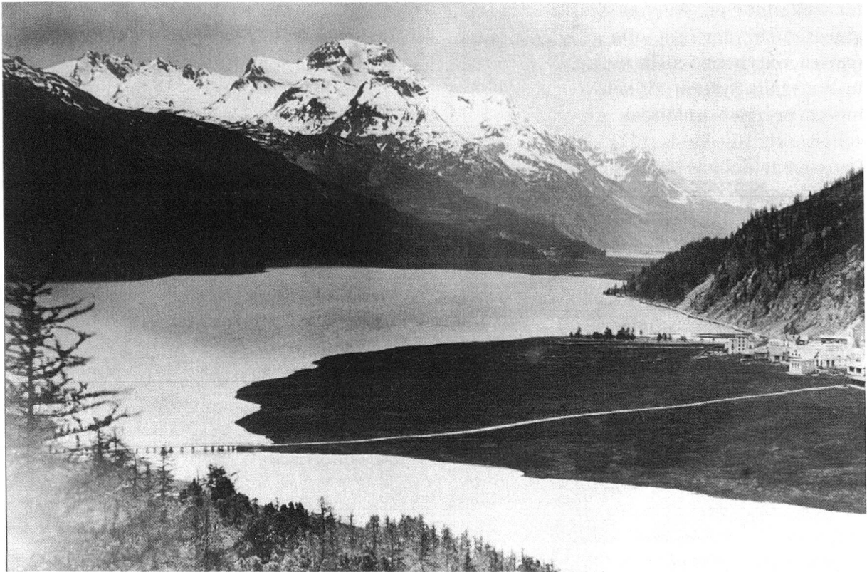
Silvaplana um 1880.