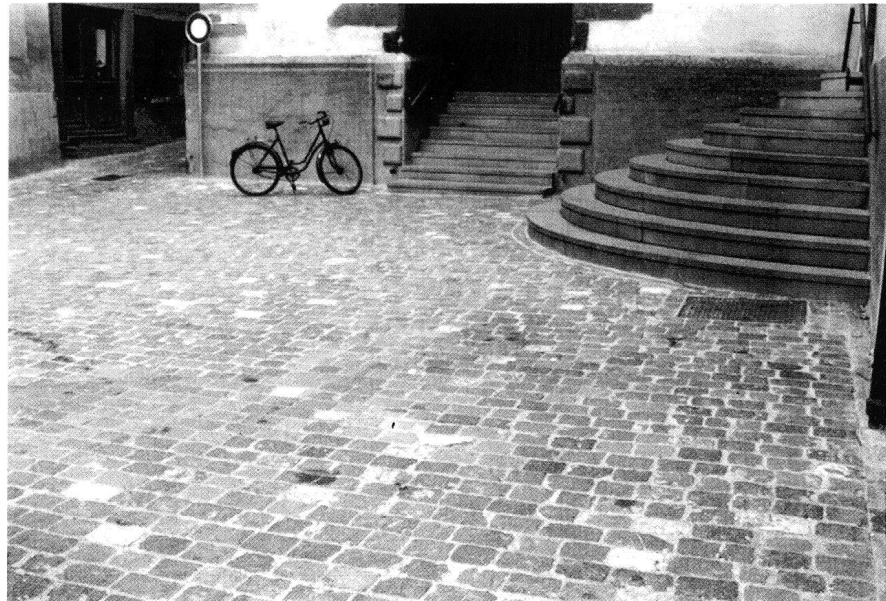
Abb.2: Chur: Martinsplatz mit neuer Pflasterung 1995.

Im Engadin sind Zugänge zu Cuort (Stall) und Sulèr (Hausdurchfahrt) als fallende bzw. steigende Rampen angelegt. Diese Schrägflächen sind meist mit Rundkieseln gepflastert. Bei sehr steilen Rampen sind in der Pflasterfläche zudem Trittstufen ausgebildet. Sie erleichtern nicht nur dem Menschen den Zugang zu Haus und Stall, sondern waren auch eine Hilfe für die Zugpferde, welche mit schwerbeladenen Heuwagen diese Rampe zum Sulèr überwinden mussten um durch ihn in den Heustall zu gelangen.