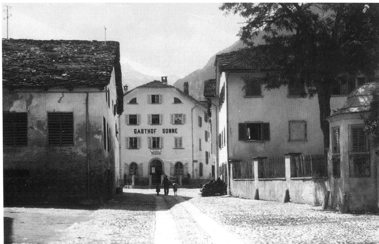
Abb. 1: Andeer. Veia principala mit historischer Pflästerung.