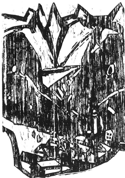
Bondasca, 1984, Holzschnitt, 70 x 50 cm

Holzbeschaffung bis zum Handabzug, alles selbst zu machen. Als ein Beispiel für viele sei der Holzschnitt Bondasca, 1984 (Nr. 79) in seiner bizarren und archaischen Ausdruckskraft genannt.