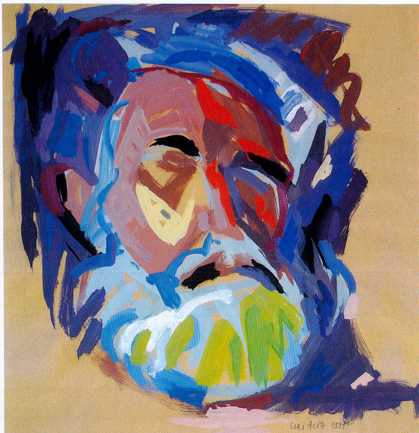
Hom Barbus, 1991, Gouache, 64 x 61 cm

Die Wahl ihrer Motive ist naheliegend und nicht ungewöhnlich: Stilleben, Interieurs, Porträts ihrer Angehörigen und Freunde oder Porträtaufträge – und wunderbare Katzenbilder, die so nur eine Katzenkennerin und Katzenfreundin malen kann