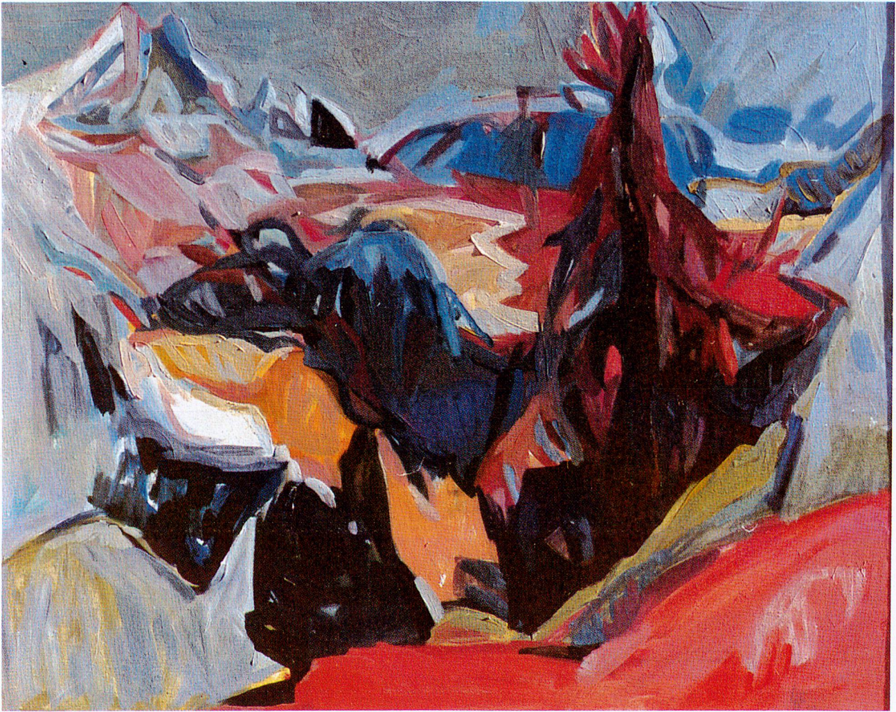
Piz Corvatsch, 1989, Öl, 50 x 61 cm

regte andere an, öffnete ihnen Herzen und Sinne. Wir begegnen einer Künstlerin von grosser Menschlichkeit und Wärme, voll Temperament, ja Jugendlichkeit. Da war nichts Abgeklärtes, Resigniertes. Sie war ein Mensch «aus einem Guss». Sie verkörperte Harmonie, Ausgewogenheit, vornehme Noblesse, Bescheidenheit. Dabei sprühte sie vor Leben, Energie und Humor, sie war voller Farben wie ihre Gemälde. Gleichzeitig spürte man ihre Sensibilität, ihre feinfühlig, verletzte Seele. Doch sie war auch tapfer, mutig, beherzt, tatkräftig und stark. Und nicht zuletzt war sie eine schöne Frau