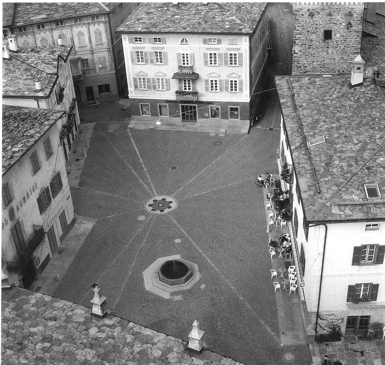
«Der Dorfplatz» 1989