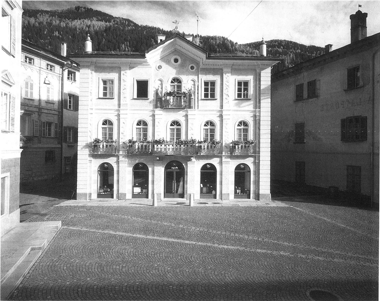
«Das Private» Casa Gervasi 1989