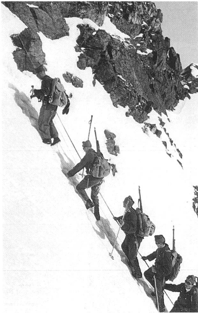
Am Piz Languard

nach oben gelegt, darauf eine Zeltblache, eine Schicht Zeitungen und wieder eine Zeltblache. Diese Unterlage sollte uns vor Kälte und Nässe schützen. In Bauchhöhe wurde eine Kerze angezündet. Sobald diese erlosch, musste frisch gelüftet werden.