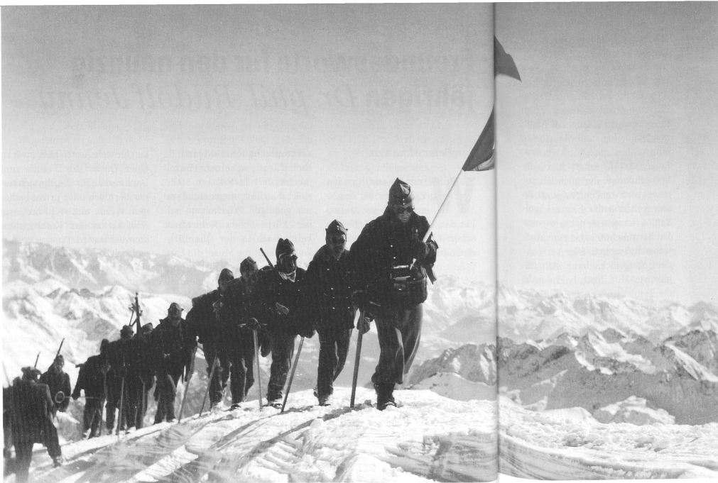
Auf dem Gipfel des Piz Palü