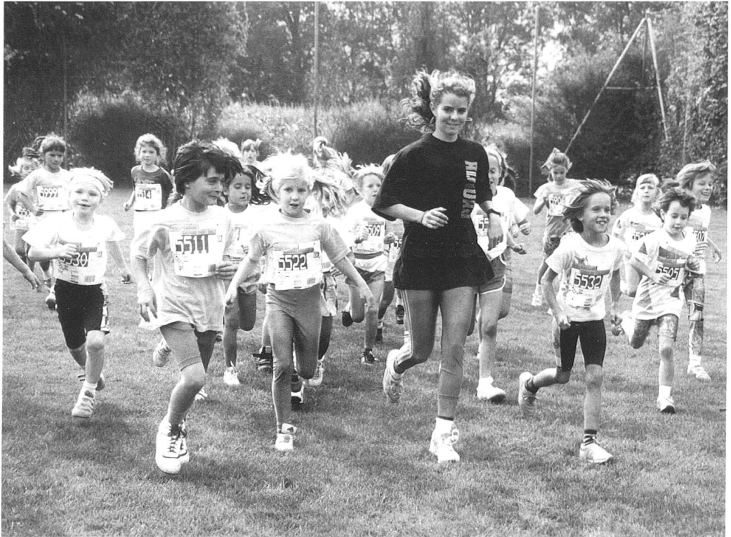
Läufergruppe Volkslauf Grand Prix Chur, 14. September 1991.

E s sind nicht die aktuellen Widersprüche des Gesundheitswesens mit seinen vielen Akteuren wie Ärzten, Spitälern, Versicherungen und Patienten oder das Seilziehen um den Spitalplatz Chur oder die regionale Spitalversorgung, die uns hier beschäftigen sollen, sondern – in einer etwas distanzierteren Optik, wie sie dem Bündner Jahrbuch eigen ist – länger wirkende Entwicklungen im Bereich von Gesundheit und Sport. Die verschiedenen