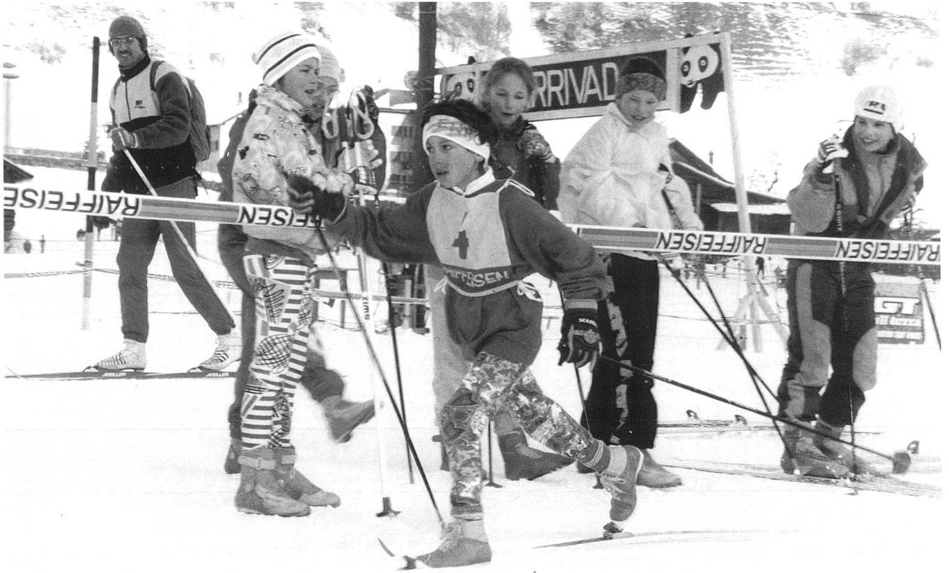
Jugend + Sport-Langlaufwoche in Truns am 17. Februar 1994.

den Erziehungsdepartementen unterstellt und nur in drei Kantonen den Militärdirektionen zugeordnet.