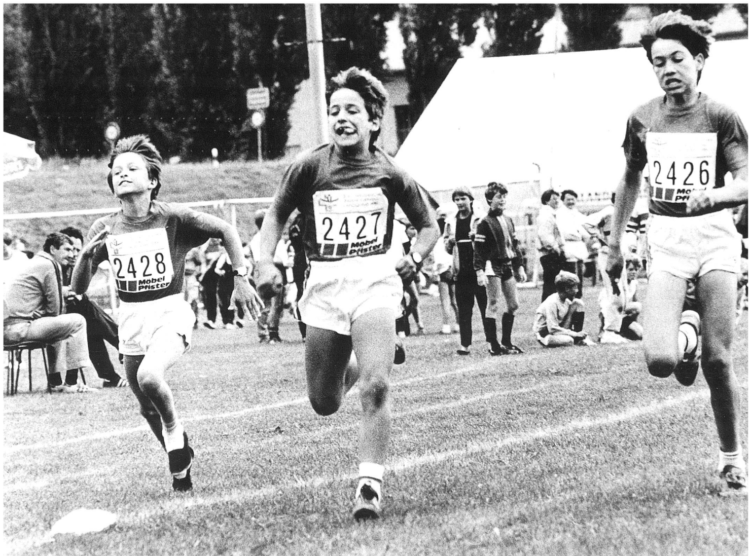
60-m-Lauf, Schweizer Jugendtage in Landquart 7./8. Juni 1986.