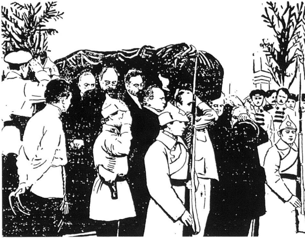
Transferring the casket