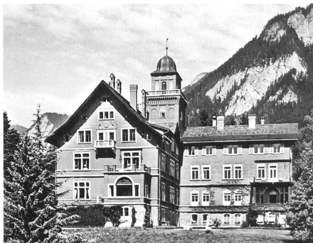
Kantonales Frauenspital Fontana, in welchem Neumünster-Diakonissen während Jahrzehnten wirkten.