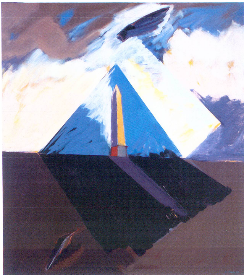
«Mediterraneo», 1979, Öl auf Leinwand, 110 x 100 cm. (Sammlung UBS, Basel)