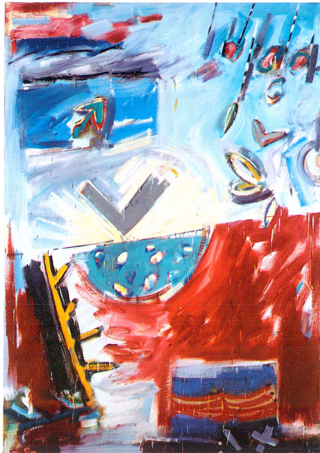
«Ohne Titel 93/2», 1993, Öl auf Leinwand, 190 x 135 cm. (Sammlung Roche, Basel)

Bergkette der Alpi Orobie, vom Heimatdorf aus gesehen der südliche Horizont des Veltlins und somit ein seit den Tagen der Kindheit vertrautes Erscheinungsbild, vereinfacht sich immer mehr und wird allmählich zur Berg-Pyramide, zum Dreieck; aus einem Horizont werden mehrere Horizonte, «die in mir drin stets gegenwärtige Bergsilhouetten als eine reale Ebene und ein ins Unendliche hinein projizierter Horizont als eine imaginäre, geistige Ebene». Und dazwischen erscheint «etwas Schwebendes als verbindendes Element»: Die im Herbstwind fliegenden Drachen, die Ende der Sechzigerjahre einen thematischen Schwerpunkt gebildet haben, besinnen sich nun ihres