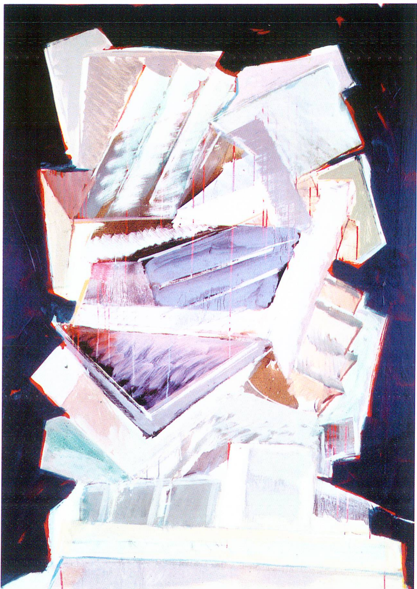
«Fragmentensäule», 1975, Öl auf Leinwand, 130 x 100 cm. (Privatsammlung, Chur)

Dass seine Ausbildung in Basel erfolgreich verlaufen ist, be-