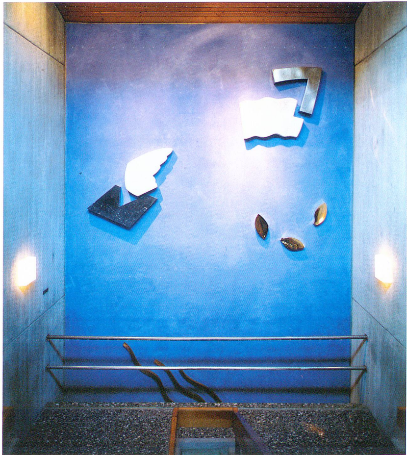
«Volo» (Flug), 1984–85, Treppenhaus Oberstufenschulhaus Bonaduz.

Für einen andern wäre dies ein Grund zur Resignation, er jedoch macht sich auf, die letzten Spuren der einstigen Hochkultur zu suchen, im Skizzenbuch festzuhalten, zeichnend und schreibend. Der «Säulentraum» entwickelt sich trotz Patina zur klaren Form: marmorne Reste von Säulen und Kapitellen, Trümmer von Monumenten und Statuen, Bruchstücke von Friesen und Obeliskten, die in den tiefblauen Himmel ragen. Und dieser Him-