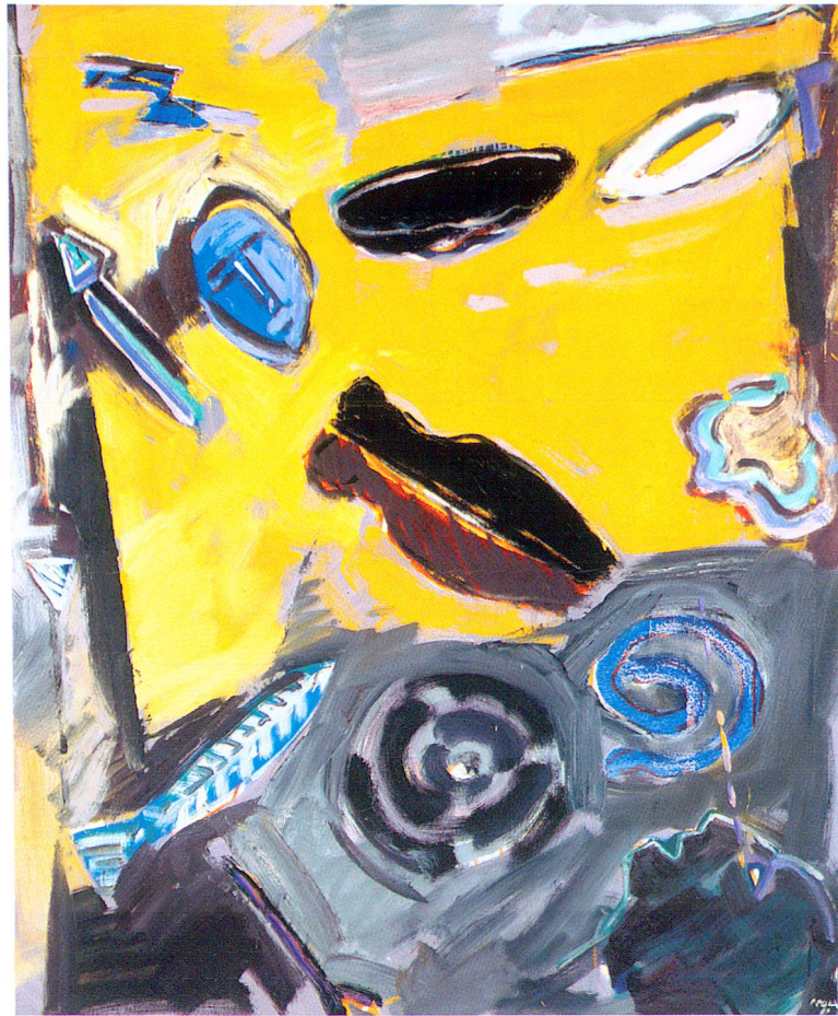
«Zeichen vor Gelb», 1989, Öl auf Leinwand, 145 x 120 cm. (Privatsammlung, Chur)