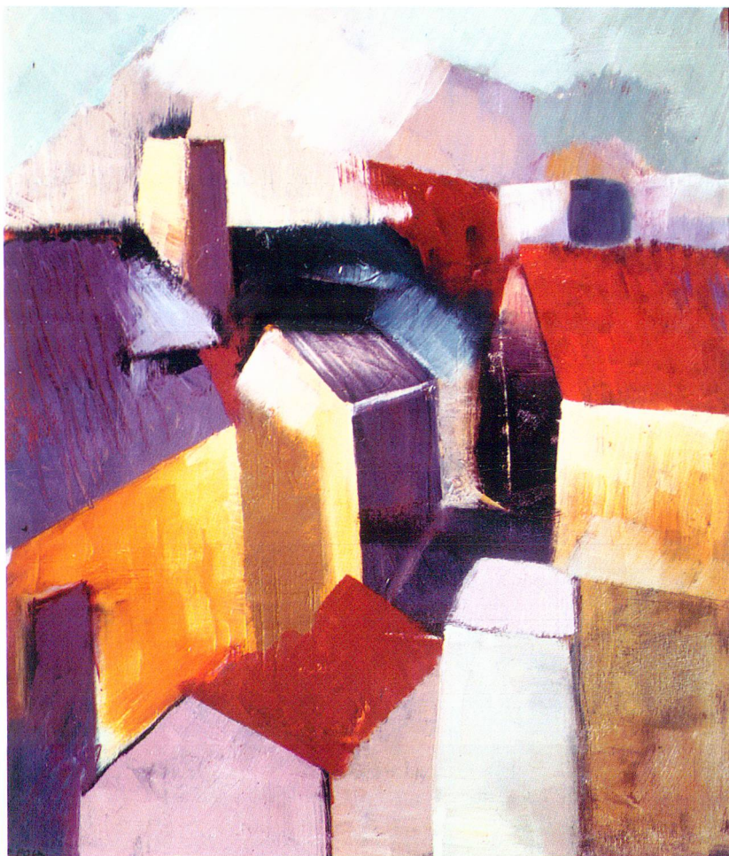
«Case», 1966, Öl auf Pavatex, 60 x 45 cm. (Privatbesitz, Chur)

klar war, ob ich ein längeres Fernbleiben von zuhause überhaupt aushalten würde. Noch während der Ausbildung in Basel standen die Koffer stets gepackt in meinem Zimmer.» 2 Aber allmählich erwächst ihm aus der Sehnsucht nach dem «valle perduta», nach dem verlorenen Tal, eine neue Kraft, dank der er das, was er für seine Südbündner Heimat empfindet, zu verarbeiten und später weiterzugeben vermag.