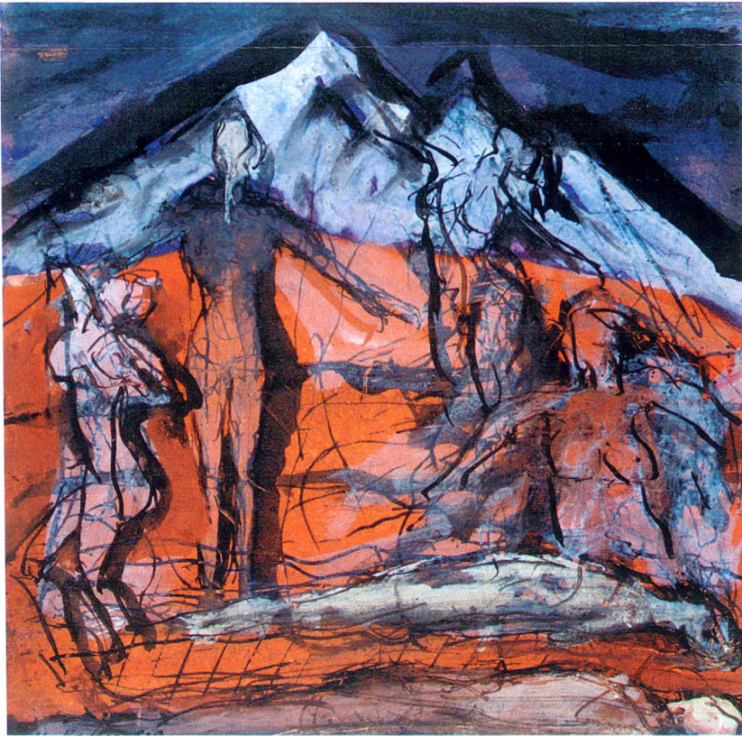
Der Berg, wo Tod und Leben sich berühren, Tusche, Tempera auf Papier, 21 x 30 cm, 1989.

Spitze sitzt fast genau in der Bildmitte. Rechts oben, nicht ganz frontal, ein Torso, isoliert. Links in der Grenzzone zwischen der brandigen Masse und der Bergfläche eine in Kniehöhe angeschnittene, mit der Halspartie und dem Kopf die Berglinie überragende Frauenfigur, neben ihr, noch völlig mit dem Berg verschmolzen, eine weitere weibliche Gestalt. Den Hauptteil der Bergfläche aber füllen sperrig hingekritzelt und in die Farbmaterie eingegrabene menschliche Zeichen. Bedeutsam an diesem Blatt sind die klar definierten Zonen: Himmel – Berg – Feuer (Erde). Das Zeichen für den Berg dominiert als Verbindungsteil die Komposition. Eindeutig scheint zudem, dass aus einer buchstäblich unbeschreibbaren,