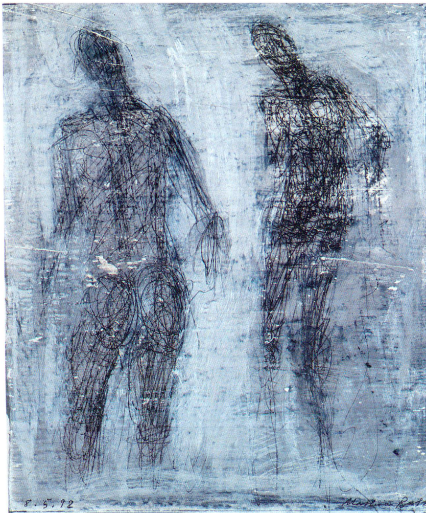
Ohne Titel, Lithokreide, Deckfarbe, Bleistift, 25 x 21 cm, 1992.

Nehmen wir zum Ausklang eine Arbeit aus dem Jahre 1992. Sie zeigt zwei Akte in leicht gebeugter Haltung mit angezogenen Oberarmen. Auf den lasierend aufgetragenen Farbgrund zeichnete, besser: kratzte der Maler mit einem harten Stift die Figuren in den Grund hinein, gewisse Beschädigungen desselben in Kauf nehmend. Der zeichnerische Duktus ist grosszügig, er besteht aus hastig hingeworfen wirkenden Linien und Kreisbewegungen. Da die Randzonen offen bleiben, verdichten sich die Dunkelheiten gegen die Körpermitten hin. So entsteht der Eindruck, dass sich die Körper auflösen. Aber es handelt sich hier um ein anderes Phänomen als dasjenige, mit dem sich Alberto Giacometti – ein von Mathias Balzer hochgeschätzter Künstler – mehr als sein halbes Leben