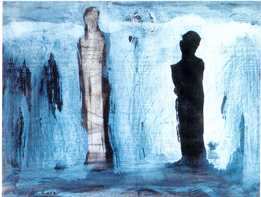
Der Berg, wo Tod und Leben sich berühren Bleistift, Chinatusche, weisse Tempera auf Papier, 25,0 x 33,5 cm, 1991.

Das mit Deckweiss überarbeitete Tuscheblatt entstand im Februar 1991. Es zeigt eine Begegnung in einer tiefenfreien Landschaft mit einer hochliegenden wellenförmigen Abschlusslinie. Davor stehen zwei Figuren, eine hell, die andere schwarz-silhouettiert, und in der obersten Bildzone ein Tierkopf, dessen Auge genau auf der senkrechten Mittelachse platziert ist. Welcher Gattung dieses Tier angehört, ist schwierig zu bestimmen. Der obere Kopfteil weist in Richtung einer Katze, im unteren Teil der Kieferpartie gleicht es eher ei-