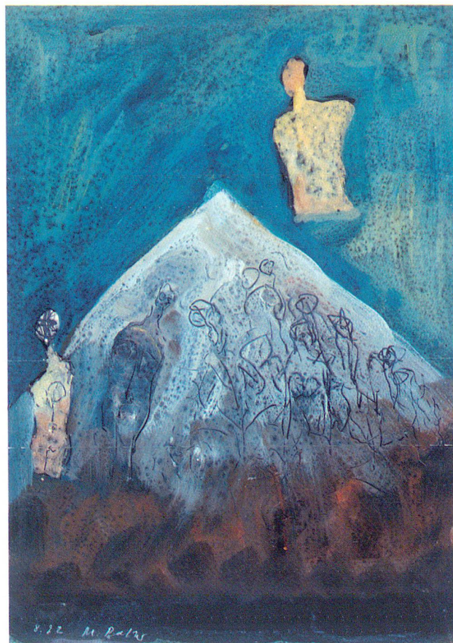
Der Berg, wo Tod und Leben sich berühren Gummitemperra und Bleistift auf Papier 33 x 24,5 cm, 1992.

So auch in der Arbeit aus dem Jahre 1992. Aus einer formal diffusen rötlichen Masse, man könnte an Lava denken, hebt sich als helles Zeichen dreieckförmig der Berg in den blaugrüntonigen Hintergrund. Seine