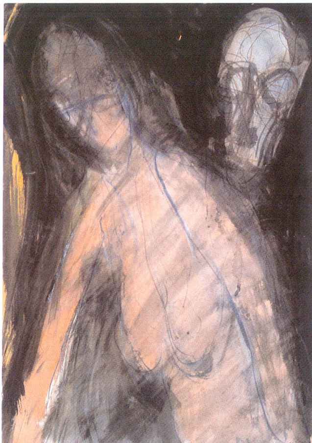
Portrait Eisengallustinte, Aquarell, Fettkreide, Tintenstift auf Papier 67,5 x 48,5 cm, 1990.

definierbaren, offensichtlich die Lippen bewegenden Wesen und der aufmerksam zuhörenden, keineswegs erschreckt wirkenden männlichen Figur in Rückenansicht. Sie steht da mit vor der Brust verschränkten Armen, leicht schräggestellten Schultern, die sogar etwas Körpertiefe erzeugen, und geneigtem Kopf. In schroffem Gegensatz dazu die senkrecht stehende, wie aus einem Block geschnittene, verhüllte und verschnürte Figur rechts. Die Körperpartie leicht abgewendet, scheint der Kopfteil dieselbe Richtung einzunehmen wie derjenige des Tiers.