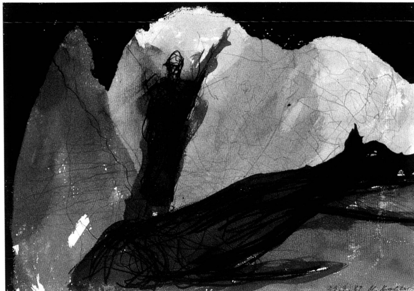
Der Berg, wo Tod und Leben sich berühren, Bleistift, Chinatusche auf Papier, 21 x 30 cm, 1989.