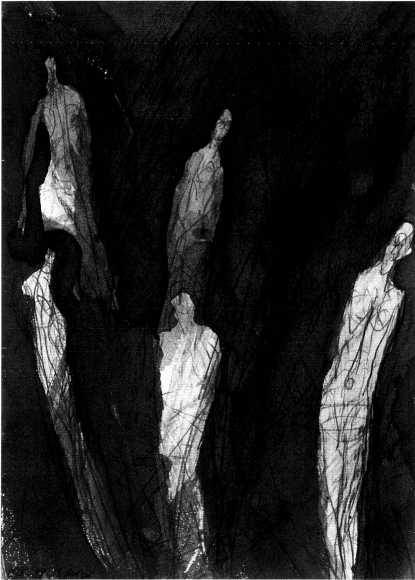
Der Berg, wo Tod und Leben sich berühren Bleistift, Chinatusche auf Papier, 29,5x20,5 cm, 1989.

Figur im hemdähnlichen Gewand mit den ausgestreckten Armen zwischen dem liegenden Tier und der hellen Bergwand, die direkt in den schwarzen Himmel überführt? Sie scheint noch zu wachsen, sich gar aufzulösen. Es ist eine auffallend fächerartig aufgebaute Komposition, mit dem Drehpunkt im linken unteren Bildfeld.