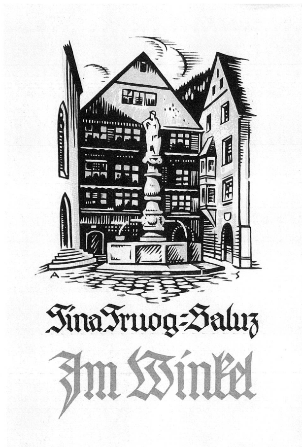
Im Winkel, Ersterscheinung 1925.

Die Texte von Truog-Saluz kennzeichnen sich durch ein wohltuendes Mass an Humor. Nicht Sprachkomik allerdings zwingt die Leser immer wieder zum Schmunzeln und Lachen, sondern die zahlreiche direkt formulierte und feine ironische Schelte menschlicher Schwächen. Insbesondere der Berufszweig der irdischen Diener Gottes beider Konfessionen wird häufig zur Zielscheibe der Autorin. Schmunzelnd erhebt sie den Zeigefinger gegen pfarrherrliche Autoritätsanmassung, pro-