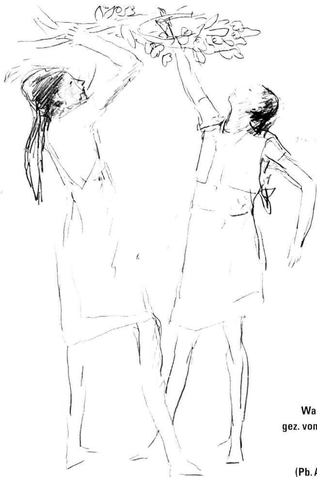
Entwurf zu Wandgemälde Daleu, gez. von Alois Carigiet um 1952, Bleistift auf Papier. (Pb. A. Crottogini, Chur)

Das erste Drittel der Fassadenbreite nimmt ein gitterartiges Rastergebilde ein, dessen breitlinige Quadrate in weissen Strichen die Fläche bis zum Giebel füllen. Daneben sind vier Mo-