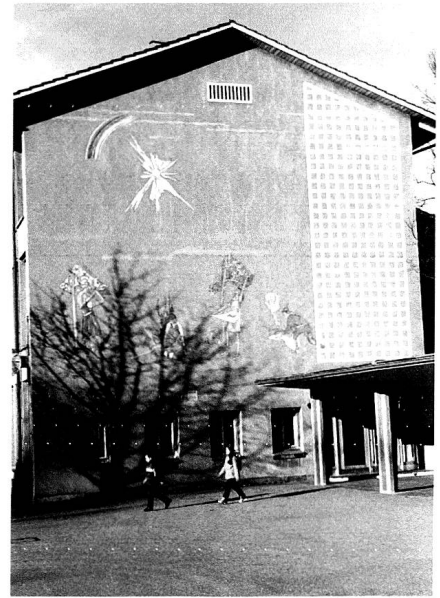
Schulhaus Daleu in Chur, Ostseite, mit Fassadenbild «Die Jahreszeiten» von Alois Carigiet, 1952, restauriert 1974 (vgl. Stadtarchiv F01.135a-e).

zung Carigiets. Anlass war ein Gespräch über ein Wandbild eines anderen Malers an der nahe gelegenen Erlöserkirche. Was ihn daran störte, war die detailierende, präzis-lineare Zeichnung von Gesicht und Körper der Figuren. So wirke das Ganze kalt