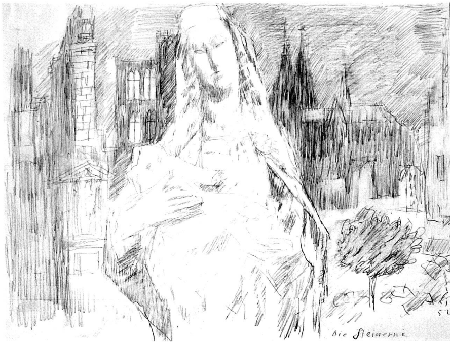
Alois Carigiet, Die Steinernerne , Zeichnung 32,5 x 42,5 cm, Köln, 1952. (Pb. P. Thalmann, Herzogenbuchsee)

und starr, statuenhaft, nicht warm-lebendig. Das zu Deutliche wirke bald langweilig, man brauche nicht mehr hinzuschauen, man habe ja schon alles gesehen. Ein Wandbild braucht natürlich eine gewisse klare Begrenzung und flächige Gestaltung. Aber aus Carigiets Bemerkung ersieht man seine Tendenz, etwas eher anzudeuten als restlos auszusprechen, wenn es ums Lebendige und auch Kultische geht.