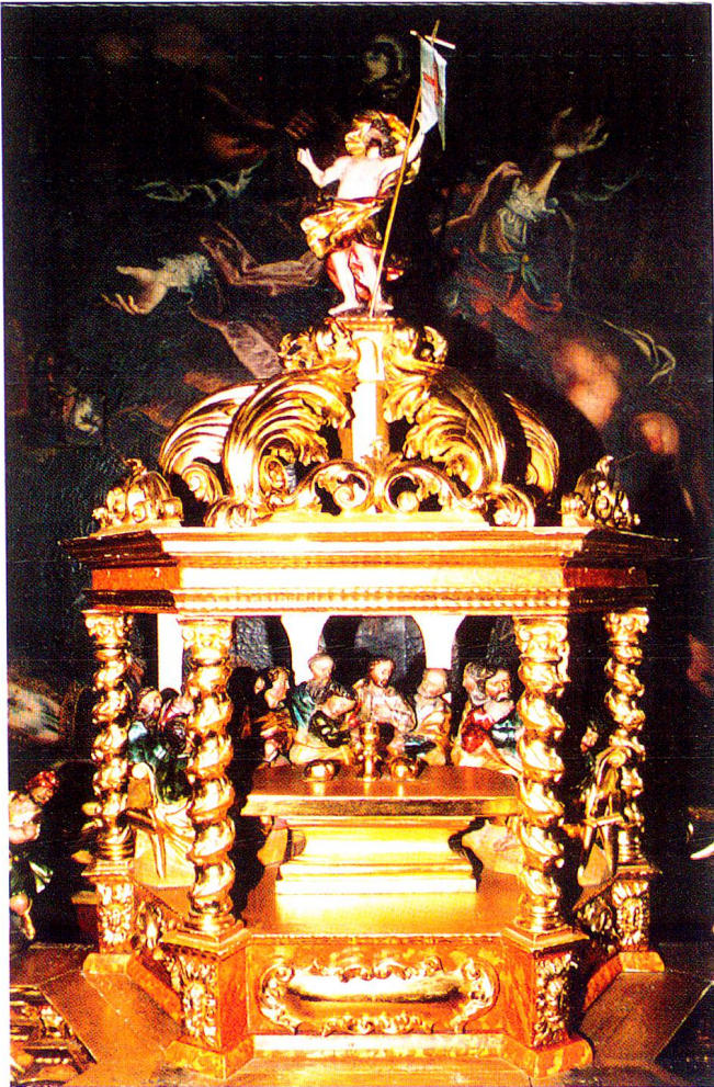
Der Tabernakel der Pfarrkirche St. Vigil in Sedrun, entstanden 1702, Schnitzarbeit.

Die liturgische Bedeutung des Tabernakels erforderte neben dem bevorzugten Standort auch eine privilegierte Gestaltung. Es entstanden meist tempelartige Bauten auf polygonem Grundriss. Ähnlich wie bei den Altären setzte man über das Hauptgeschoss ein zweites, manchmal sogar ein drittes Geschoss und verzierte den Bau mit Säulen, Gesimsen, Giebeln und Nischen, in welche man kleine Figuren stellte. Ein besonders schönes Beispiel aus Graubünden ist dasjenige in der katholischen Pfarrkirche in Brusio: Der dreistufige Tabernakel sieht einer barocken Schaufassade ähnlich, wird von kleinen Engelchen getragen und ist mit Figuren von unterschiedlicher Grösse verziert. – Dieser Tabernakel war so reichhaltig gestaltet, dass man auf ein Retabel überhaupt verzichtete.