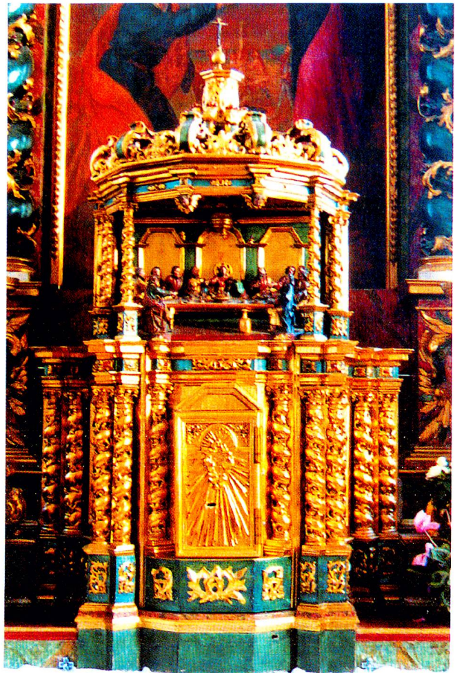
Der Tabernakel der Pfarrkirche St. Peter und Paul in Vals, entstanden kurz nach 1700, Schnitzarbeit.

Bewundernswert ist die Dichte der Darstellungen, und besonders reizvoll ist es, in diesen miniaturhaften Schnitzarbeiten besondere Einzelheiten zu beobachten: in Vals etwa den voluminösen Geldsack, den Judas mit seiner linken Hand festhält, die Weinkanne vor dem Tisch und das auf dem Rücken liegende Lamm, und in Sedrun den Kelch und die prallen Brote auf dem Abendmahlstisch, das sanfte Antlitz des Lieblingsjüngers Johannes (an der rechten Schulter von Christus) oder auch die Gestalt rechts aussen: Dieser Apostel, der aus der Gruppe herausragt, ist höchst wahrscheinlich Judas, der sich an den Betrachter wendet, als wollte er sich rechtfertigen.