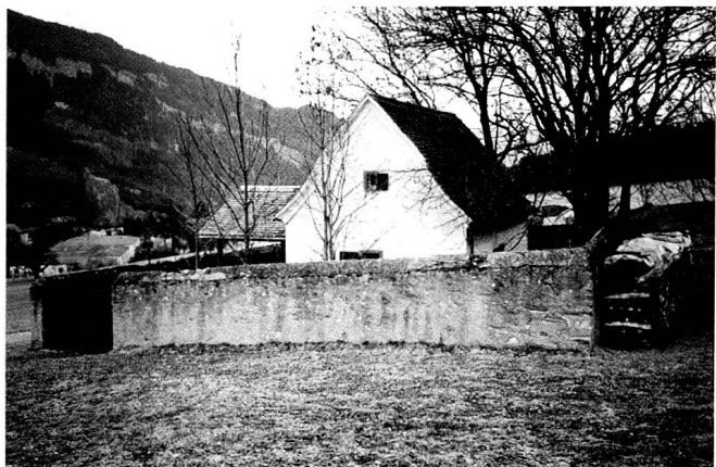
Pulverhäuschen in den Prasseriewiesen, Südansicht, erbaut 1835 als Pulver- und Munitionslager für die Kantonsmiliz.