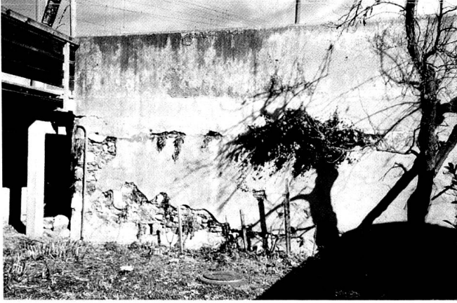
Sockel bzw. Überreste des ehemaligen städtischen Pulvermagazins am unteren Plessurkett, heute Kettweg. Nach Angaben von Frau Jeger-Hatz wurde das Magazin beim Bau der Bahnunterführung 1926 abgebrochen.

Um das Pulver bei nasser Witterung in guter Beschaffenheit behalten zu können, ist es unumgänglich nötig, dass die Stadt entweder eines ihrer Lokale längs der Strasse bis zum neuen Tor [heute Poststrasse; G.S.] dazu widme, oder ihr vor dem letzteren anführen lasse, in welchem etwa 30 Fässchen trocken aufbewahrt werden können, bis es in das Stadtmagazin abgeführt werden könne, oder verladen werde. 26