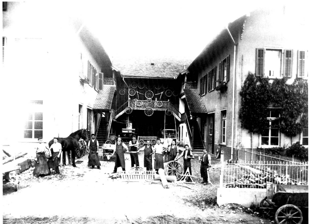
Foto: Radmacherei und Schmiede um 1900. Frage an unsere Leserinnen und Leser: Wer weiss, wo dieses Gebäude stand? – Jedenfalls nicht eingangs der Kasernenstrasse in Chur, wie man meinen möchte. Angaben nimmt gerne entgegen: P. Metz, Montalinstrasse 21, 7000 Chur.

Mario Florin: Bündner Belle Epoque in Photographien. Das Fotoatelier Lienhard & Salzborn in Chur und St. Moritz.