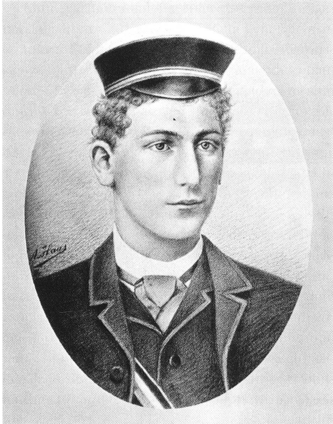
Carl Hilty als Churer Kantonsschüler, Zeichnung im Besitz der Schweizerischen Landesbibliothek. (Reproduziert nach Hilty 1949, 24)

abende im KTV gesungen: «Eine fröhliche, gemüthliche Gesellschaft, ein Glas guten Weines oder eine Halbe Bier und dabei ein fröhlicher, schallender Rundgesang, das sind Dinge, die keinem theurerkauften Vergnügen nachstehen, die einem das Herz im Leibe wahrhaft aufthauen, Berge von Jammer und Sorgen abwälzen und auch das beste Mittel für Missmuth und Welt-schmerzen sind.» 7 Zudem zählte Hilty zu den elf strammen Bündnern, die am 23. August 1849 über den Panixerpass zu Fuss ans Eidgenössische Turnfest in Zürich marschierten und aus denen später fünf Pfarrherren, ein Nationalrat (eben Hilty), zwei Ständeräte und ein Major wurden.