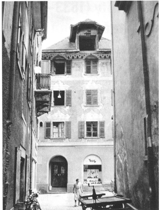
Das Haus am Majoranplatz in Chur (Poststrasse 36), wo Carl Hilty seine Kindheit und Jugend verbrachte. (Reproduziert nach Hilty 1949, 23)

Trotz alledem, aufgewachsen und zur ersten Reife gelangt ist Carl Hilty als echter «Khurar Bub», und zwar im Eckhaus Poststrasse/Majoranplatz (heute Bébéhus Imholz). Und er hat auch immer seinen Stolz auf die Bündner Geschichte und die bündnerischen Traditionen unterstrichen, wenn auch fast immer mit einem leise ironischen Unterton und spürbarer Verstimmung über die Tatsache, dass er eben doch kein hundertprozentiger Bündner sei. So, wenn er einmal über die Bündner Geschichte schreibt: «Eine Geschichte, die ihre Spuren in einem eigenthümlichen Volksthum hinterlassen hat, welches in meiner Jugendzeit noch in ungeschwächter Kraft und Originalität bestand, nun aber von den Eisenbahnen und dem grossen Fremdenverkehr allmählig auf das Niveau des gewöhnlichen Erdendaseins hinabgedrückt wird.» 2 Oder wenn er den Bündner Nationalstolz am Beispiel seiner Grossmutter umreisst: «Ein «Bündner» zu sein, war in den Augen des geringsten Bäuerleins ein unersetzbarer Vorzug vor einem St. Galler, oder selbst anderen Schweizern altfreier Kantone, und unsere mütterliche Grossmutter, die ein richtiger Typus einer Churerin war, pflegte, wenn wir Kna-