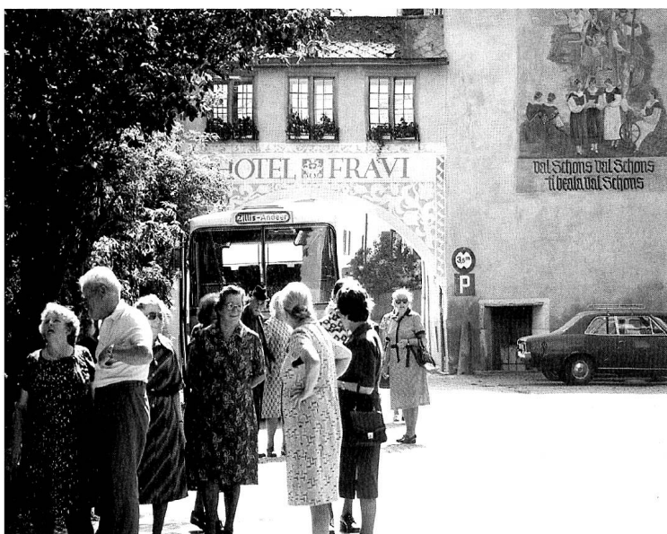
Ausflugsfahrt mit Einbezug des Bads in Andeer.

Anstelle von Saison-Wagenführern konnten mehr ganzjährige Stellen geschaffen werden. Viele dieser ehemaligen, gut ausgebildeten Saison-Wagenführer, die früher während der Zwischenzeit bei der Automobilwerkstätte in Bern tätig