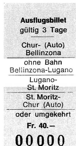
Ausflugsbillet Chur–San Bernardino–Lugano–St. Moritz–Julier–Chur.

Diese Organisationsform kann als eine Art «Vernunftsehe» bezeichnet werden. Während die Post das Leistungsangebot festlegt und garantiert, ist der Unternehmer Autohalter in seinem eigenen Interesse für den rationellen Unterhalt seiner Fahrzeuge in seiner eigenen Garage interessiert. Im Unterschied zum Postregiebetrieb zahlt der Autohalter Steuern, was für die betreffende Gemeinde von wirtschaftlicher Bedeutung ist.