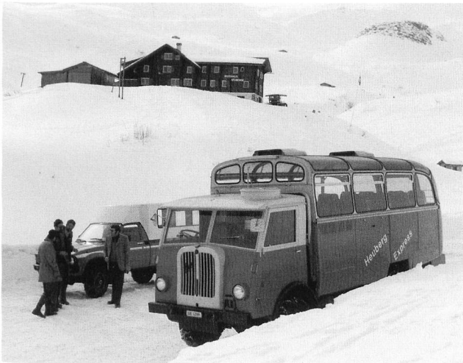
Das von Garagist Hartmann zum Postauto umgebaute Militärfahrzeug für den Dienst als Skibus mit dem ungewohnten rückseitigen Ein- und Ausstieg um 1981.