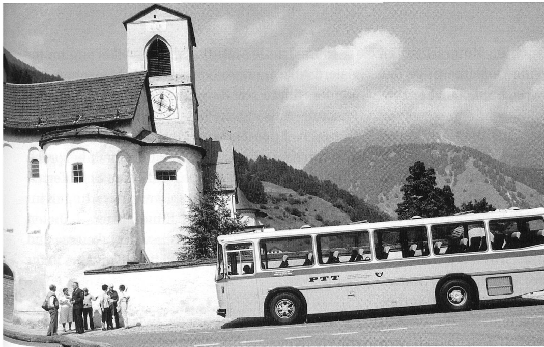
Ausflug zum Kloster St. Johann in Müstair, Foto aus den Jahren 1981–1987.