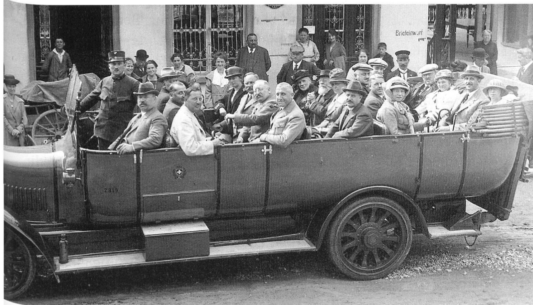
Vollbesetztes Postauto vor der Abfahrt bei der Post in Schuls um 1920.