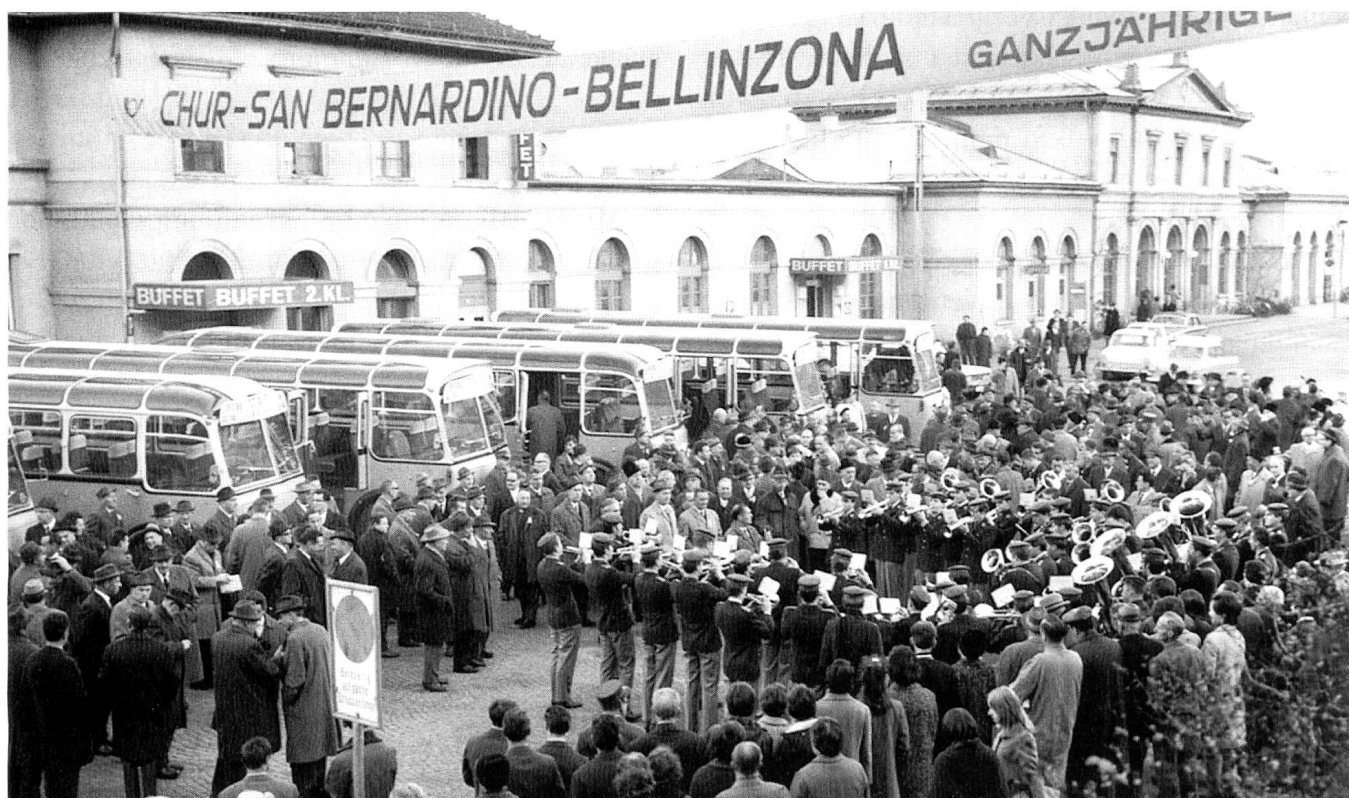
Zur Eröffnungsfahrt der neuen Postautolinie Chur–Bellinzona am 2. Dezember 1967 treffen sich vor dem Bahnhof Chur Offizielle, Musik und Publikum.

Dem Kanton fehlten noch die gesetzlichen Voraussetzungen, um aktiv werden zu können. Auch das rein schienengebundene Denken musste gesamtheitlichen Überlegungen erst noch weichen. Gemeinsames Planen und Handeln der