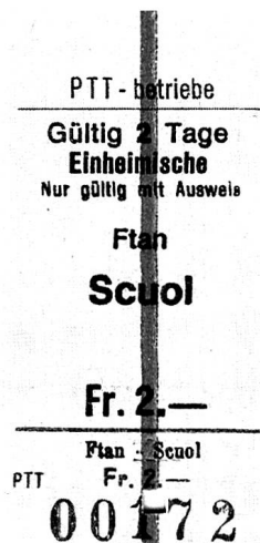
Billets für einheimische Fahrgäste.