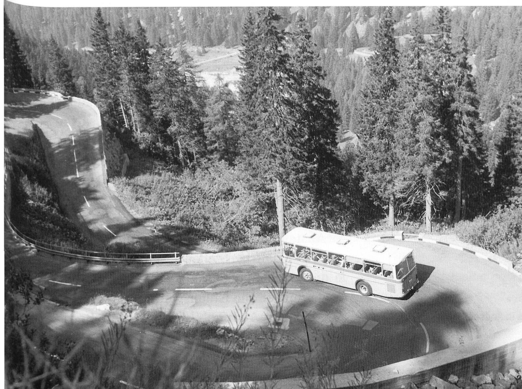
In den Strassenkehren zwischen Maloja und Cassacia, Foto aus den Jahren 1981–1987.