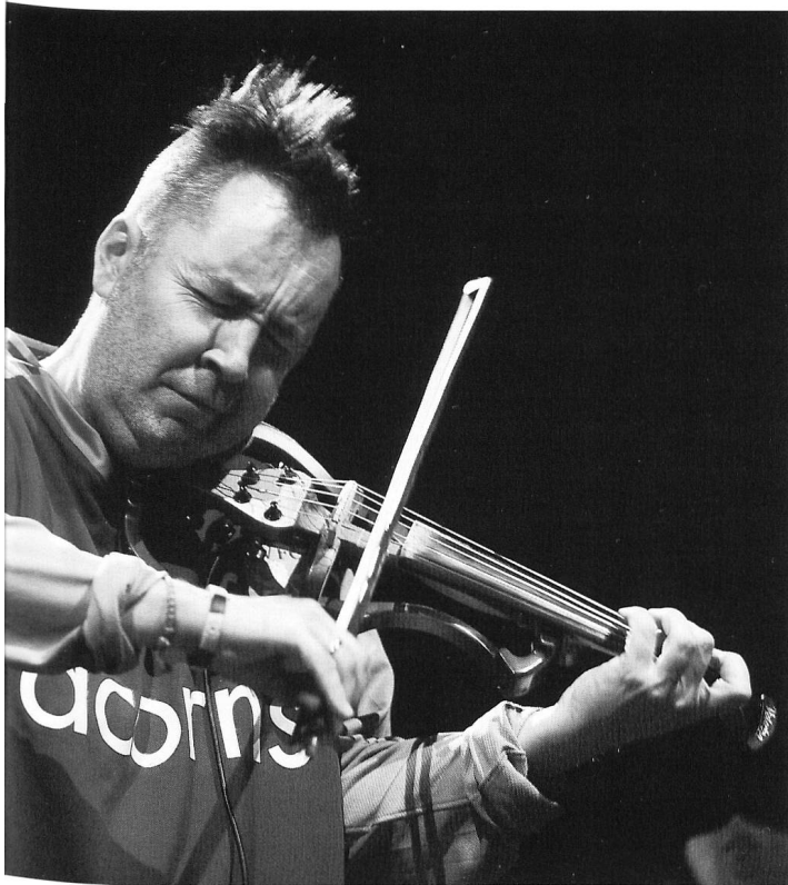
Der Geiger Nigel Kennedy am Graubünden Festival 2009.