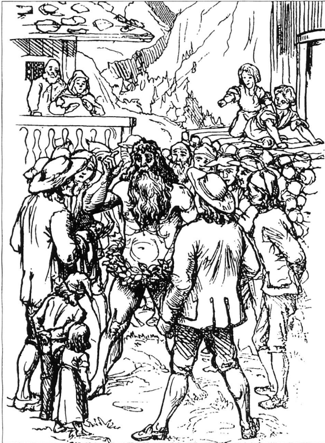
«Des wilden Männlein's Rath». Conters im Prättigau.

der Foppa/Grueb bei Junkersfamilien (Capol) herrschenden Sprachsituation festmachen. Was für den Text des politisch motivierten Glurnserliedes (Kalvenschlacht) angehen mag, kommt der poetisch-lyrischen Form des Margareta-Liedes weniger entgegen.