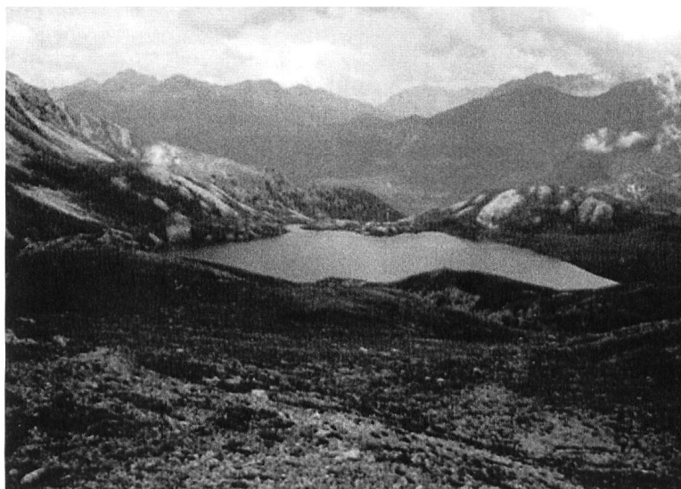
Lai da Rims (2396 m), Val Vau, Münstertal.

In Poschiavo kennt man den Salvanch, in den Dolomiten die Salvans und Salvanel. Dass der «Uomo salvadego» auch im Veltlin sein Unwesen treibt, ist bei diesem Bündner Untertanenland gegeben. Beim längst bekannten Fresko aus dem veltlinischen Val dal Bitt (Sacco/Val Gerola) kommt der Wilde Mann wie ein manierlicher Italiener daher. Seine Gestalt ist kaum furchterregend, sein Blick der eines Alpenphilosophen, lediglich der mitgeführte Prügel und seine Devise lassen den Betrachter leicht erschauern.