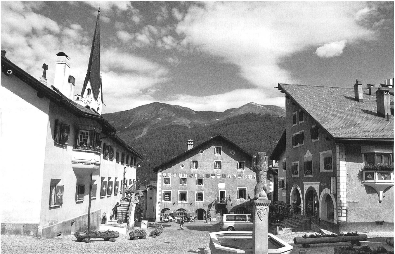
Dorfplatz Zuoz.

landamarz»-Festes, gründete Tino Walz in Zuoz die Tino Walz-Stiftung mit dem Zweck, im Kanton Graubünden kulturelle Aktivitäten wie Ausstellungen, Vorträge, Konzerte, Theateraufführungen, Konferenzen usw. durchzuführen und/oder zu unterstützen, Publikationen kultureller Art zu fördern und/oder selber herauszugeben sowie Aufgaben des Bündner Heimatschutzes zu unterstützen. Im unteren Sulèr und im Talvò der historischen Chesa Planta in Zuoz finden alljährlich Ausstellungen zu kulturellen und naturwissenschaftlichen Themen statt. Musikalische Anlässe, Theater und Lesungen runden das Programm ab. Ebenso unterstützt die Stiftung zahlreiche Anlässe wie Konzerte, Theater-Aufführungen und Publikationen im Kanton.