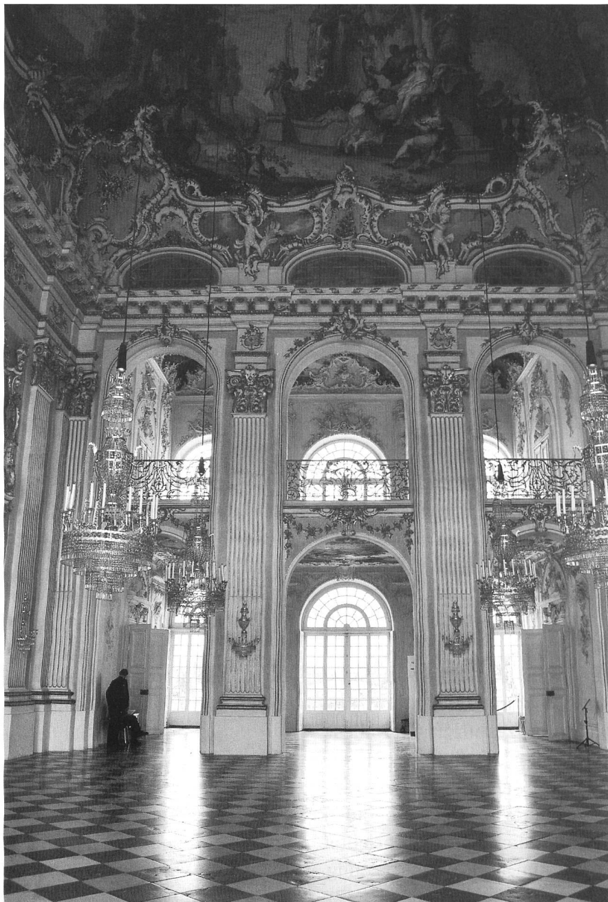
Steinerner Saal, Schloss Nymphenburg.