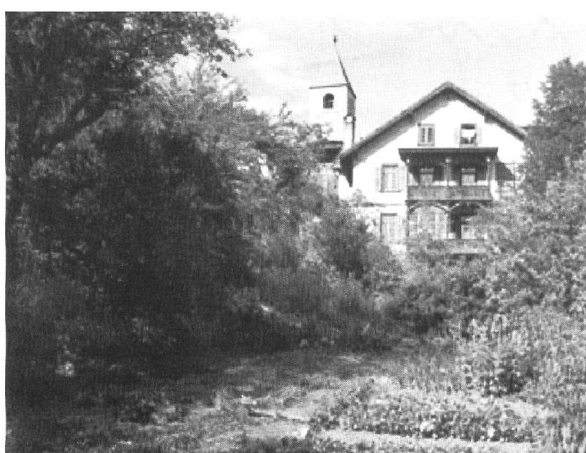
Das Haus von Luisas Grossvater, Jon Vonmoos, in Ramosch. Bild oben: Blick auf die Südfassade; Bild unten: Blick auf die Westfassade mit Holzbalkonen, im Hintergrund links der Kirchturm der Kirche San Flurin.