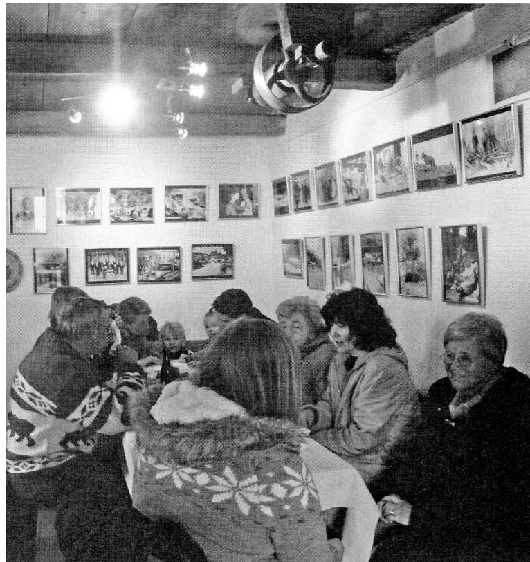
Festwirtschaft in der ehemaligen Wollkarderei am Ostersonntag 2012.