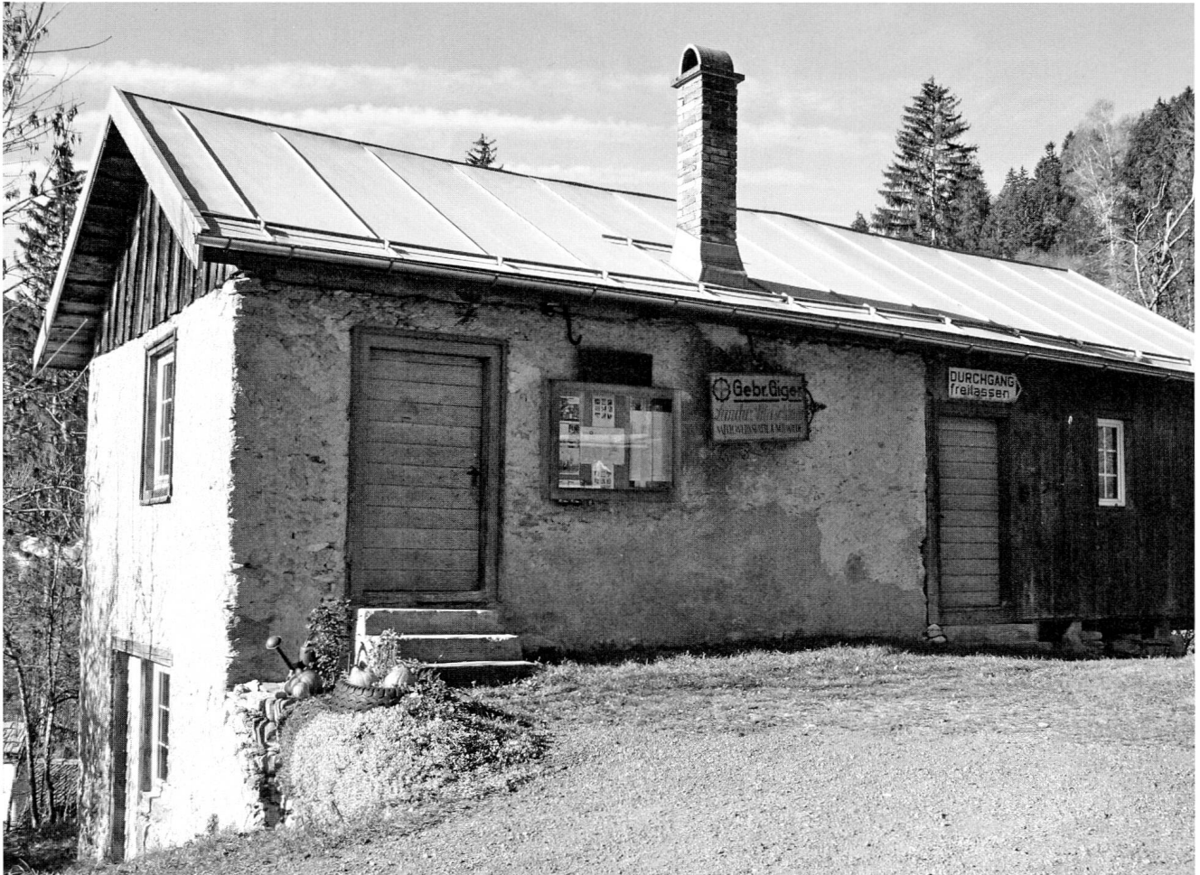
Die Werkstätte mit dem Werbeschild der Gebrüder Giger.

der Ackerbau im Kanton Graubünden allmählich an Bedeutung verlor, ging die Produktion der Pflüge zurück. Insgesamt wurden zwischen 2500 und 3000 Schnauserpflüge in der Werkstätte hergestellt.