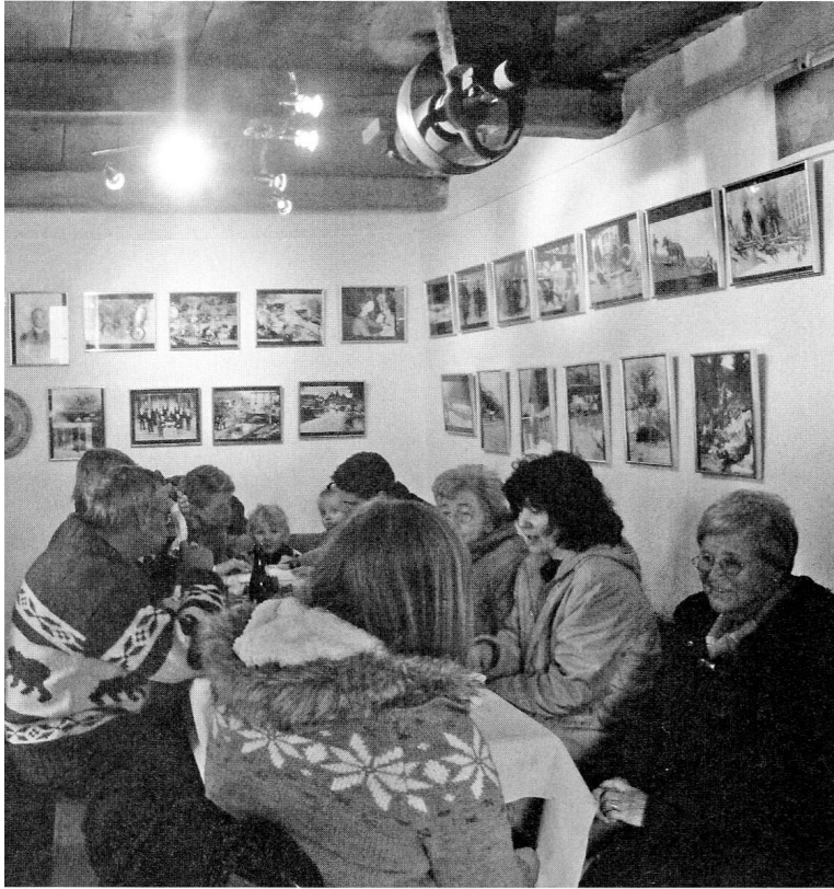
Festwirtschaft in der ehemaligen Wollkarderei am Ostersonntag 2012.