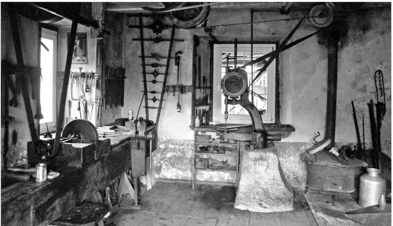
Über die Transmissionsräder werden der Schleifstein und die Bohrmaschine angetrieben.