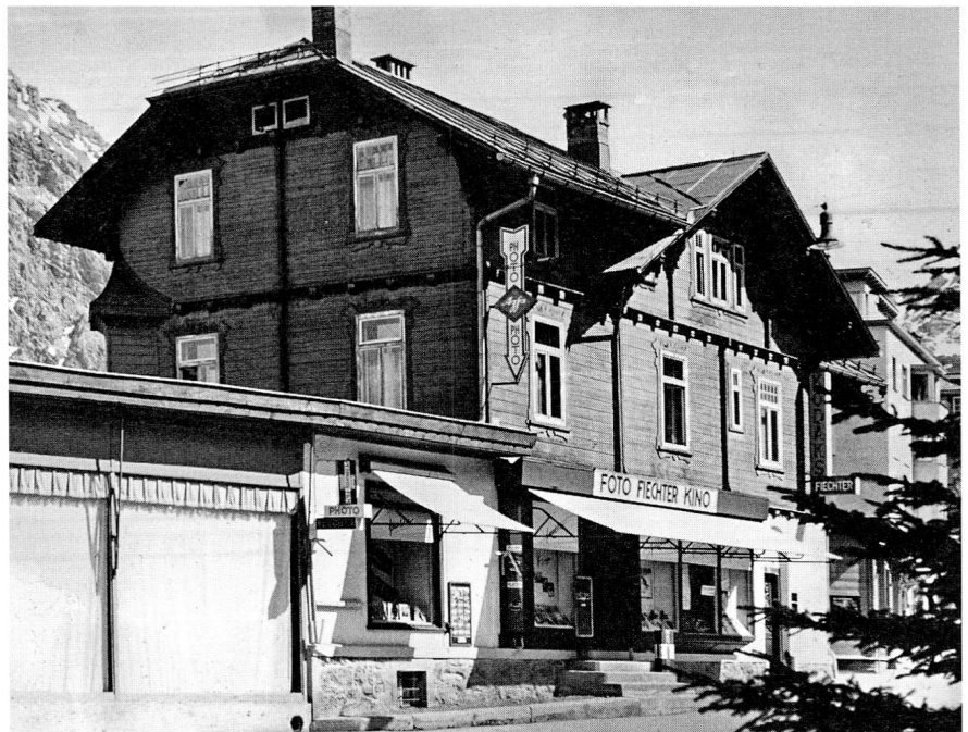
Foto Fiechter in der Villa Flora an der Poststrasse in Arosa, 1945.