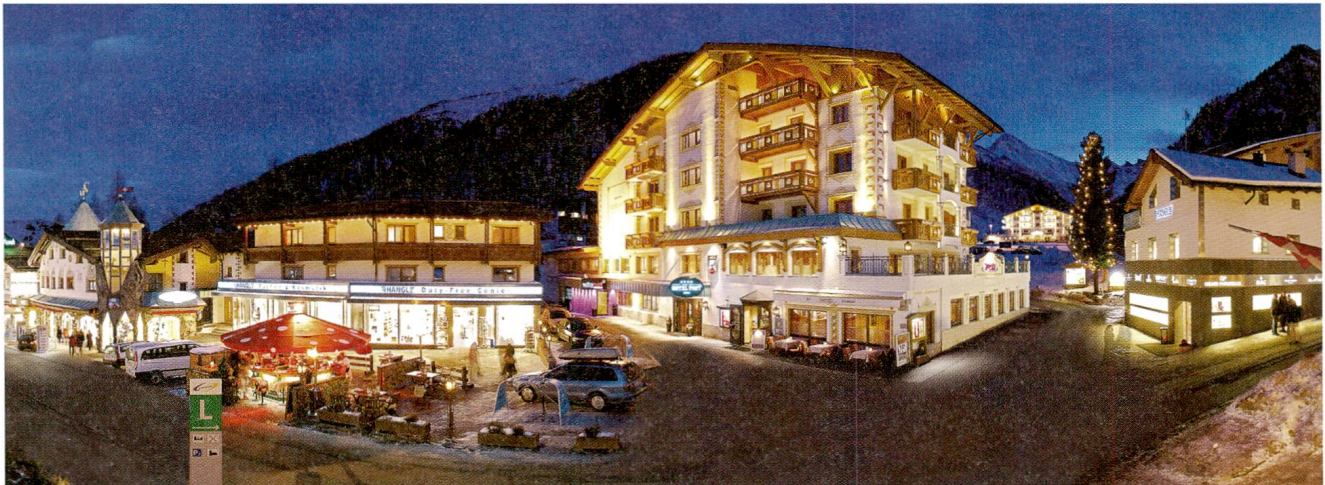
Sport- und Wellness-Hotel Post im Winter.