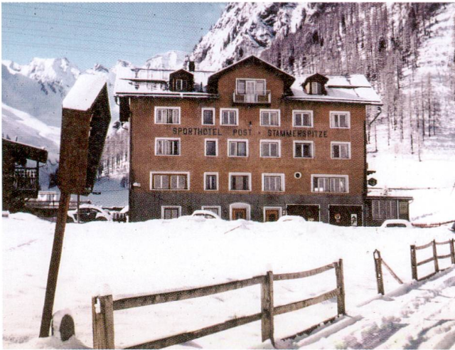
Sporthotel Post Stammerspitze 1957.