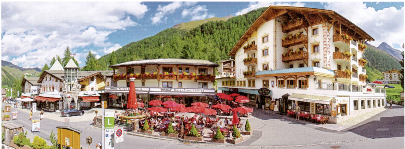
Sport- und Wellness-Hotel Post im Sommer.

Carolina, geboren 1927, starb nach einem reich erfüllten Leben plötzlich und für alle unerwartet an ihrem 41. Hochzeitstag, am 10. September 2000.