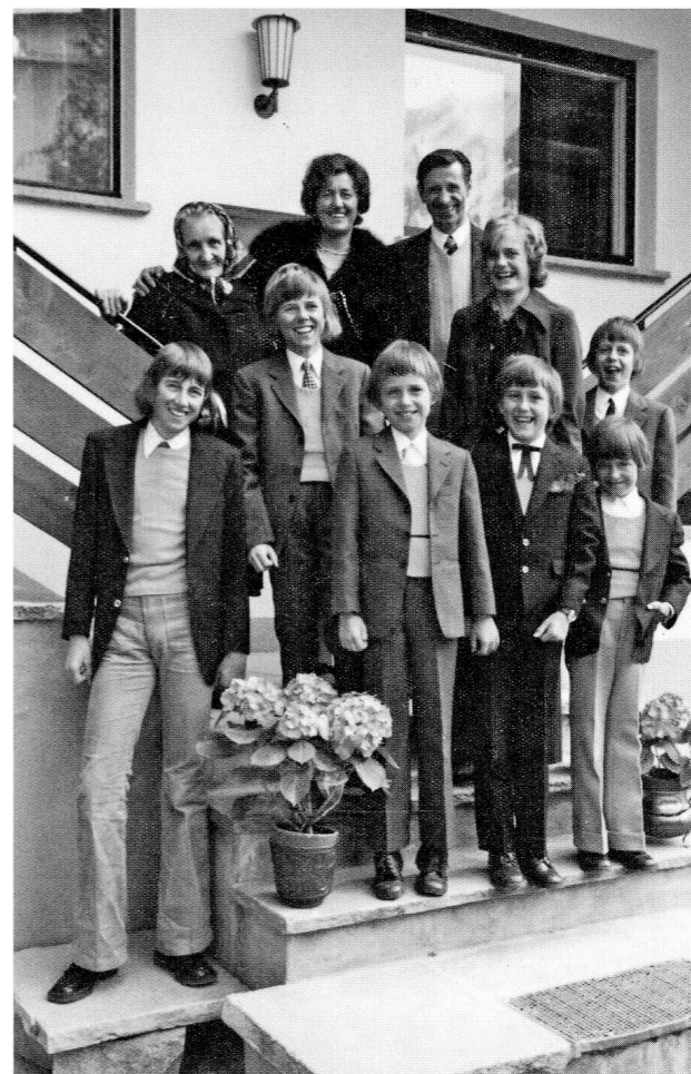
Hoteliersfamilie mit Grosi, 1970er Jahre.