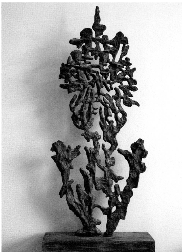
Weinende Frau, 1980.